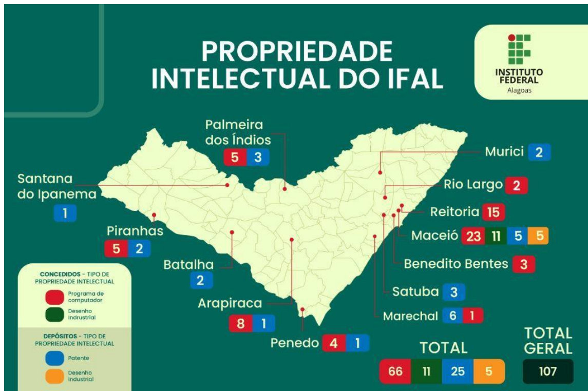
Figura 1. Localização dos Campi -IFAL, baseados na produção e aplicação da PI.

Em consulta ao site do IFAL foi identificada uma aplicação prática de produção da PI nos mais diferentes campi do IFAL (Figura 1). Desta forma, cabe observar que os campi que ofertam o curso técnico em agropecuária já registraram algum tipo de PI, sendo o depósito de patente e o registro de programa de computador os tipos mais aplicados, onde o campus de Piranhas tem 5 (cinco) registros de programa de computador concedidos e 2 (duas) patentes depositadas; o campus de Santana do Ipanema tem 1 (uma) patente depositada; e o campus de Satuba com 3 (três) patentes depositadas (Figura 1).