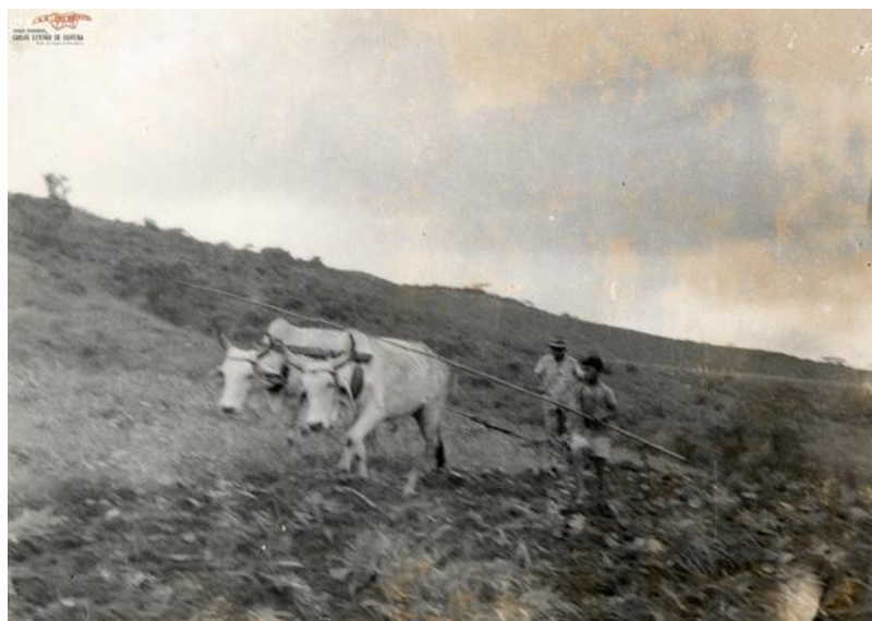
Bois do Posto Indígena Irineu dos Santos, s/d.

A princípio, o foco de atuação do SPI na Aldeia Fazenda Canto centrou-se no melhoramento da estrutura funcional e aquisição de bens necessários para a plena realização das atividades burocráticas, como os recorrentes pedidos de um “birout” e de uma máquina datilográfica a IR-4 9 . Após três anos de reconhecimento estatal, boa parte das terras da localidade tornaram-se proveitosas e surgiu a proposta de criar uma unidade produtiva para reger as relações de trabalho e envolver crianças, homens e mulheres em um sistema de produção com rígida divisão social e formação do “bom” trabalhador indígena, ou seja, aquele que atendesse aos anseios do SPI, preferencialmente, desacreditado do poder de se mobilizar; trabalhando por excessivas jornadas sem reclamar; e, sobretudo, em degradantes atividades.