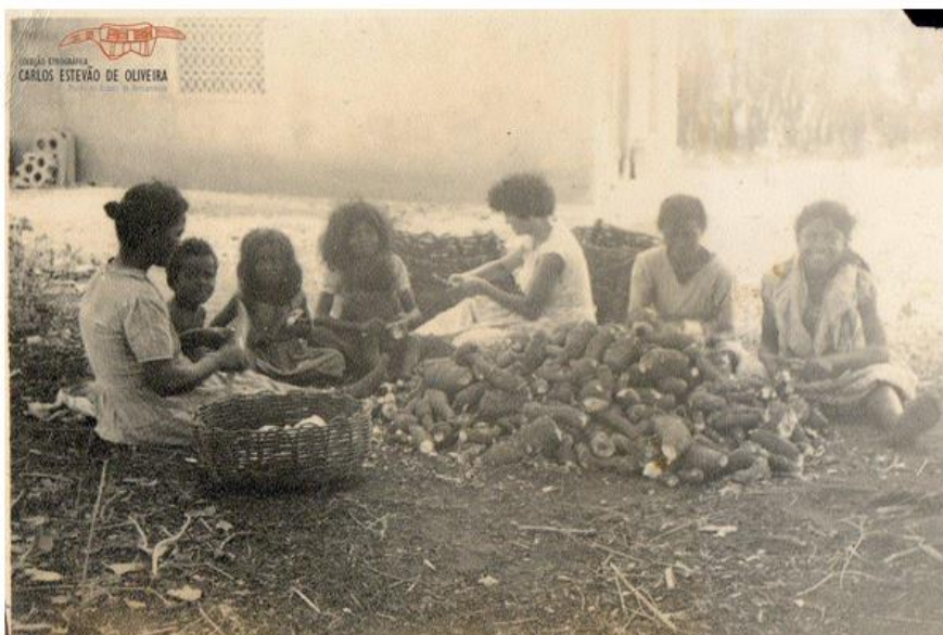
Raspagem de mandioca no Posto Indígena Irineu dos Santos, s/d.

de uma função minuciosa, a raspagem das mandiocas era atividade essencialmente das mulheres, geralmente realizada nos terreiros da casa de farinha e na companhia de crianças, registrado na fotografia apresentada a seguir: