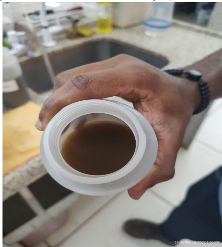
Figura 3 - Amostra de vinhaça para análise.

O profissional na área química da usina deve coletar no mínimo duas amostras da vinhaça, gerada na safra (Figura 3), para a análise de pH; dureza; condutividade elétrica; nitrogênio nitrato; nitrogênio nitrito; nitrogênio amoniacal; nitrogênio Kjeldhal; sódio; cálcio; potássio; magnésio; sulfato; fosfato total e resíduo não filtrável total (JAQUELINEN, 2007).