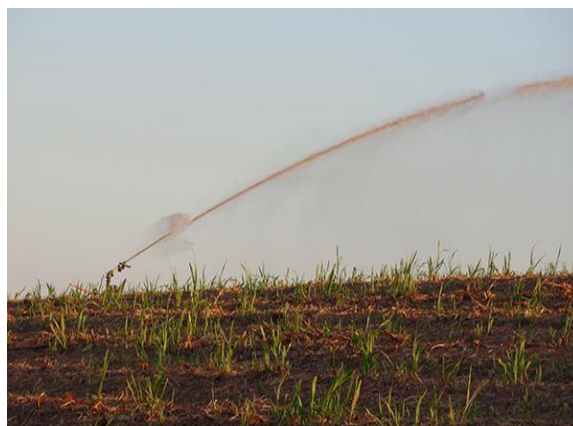
Figura 5 - Fertirrigação da vinhaça em canavial.