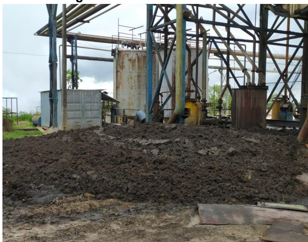
Figura 4 - Torta de filtro.