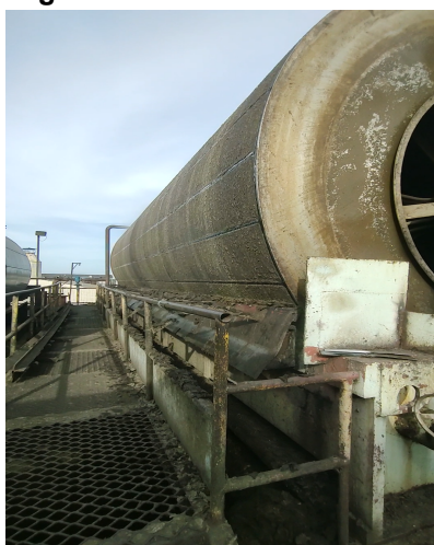
Figura 2 - Filtro rotativo a vácuo.

A torta de filtro é derivada do processo de produção do açúcar, onde é separada do processo nos filtros rotativos a vácuo (Figura 2).