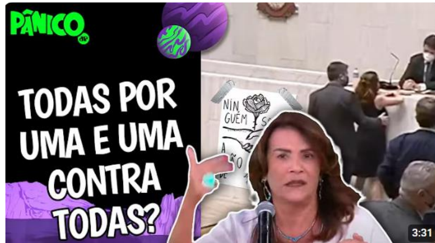
Figura 2 - Vídeo do “Pânico na Jovem Pan” sobre o caso Isa Penna