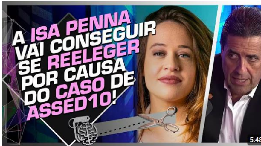
Figura 3 - Vídeo do “Cortes do Inteligente” com o Deputado Olim