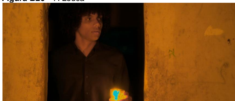
Figura B26 – A Louca