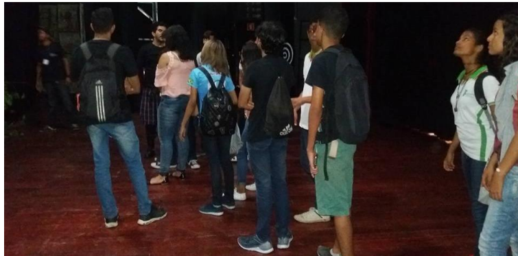
Figura B15 – Conhecendo os bastidores do T. Deodoro