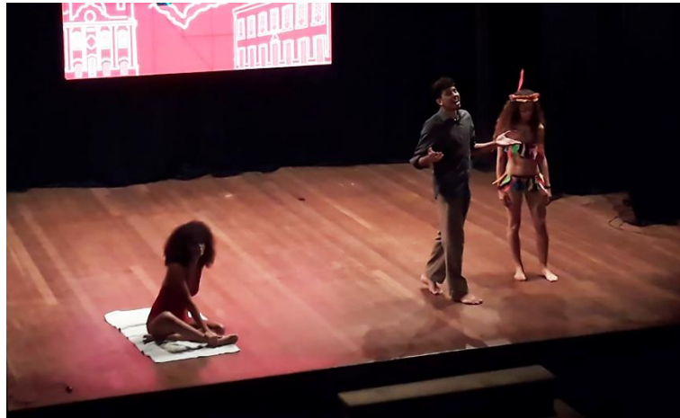
Figura B10 – Antropofagia cultural