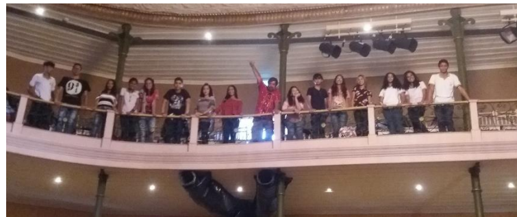
Figura B16 – Plateia no T. Deodoro