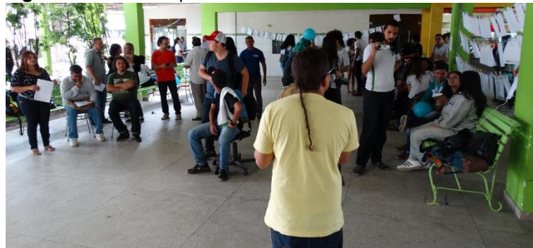
Figura A12 – Sarau poético da Primavera