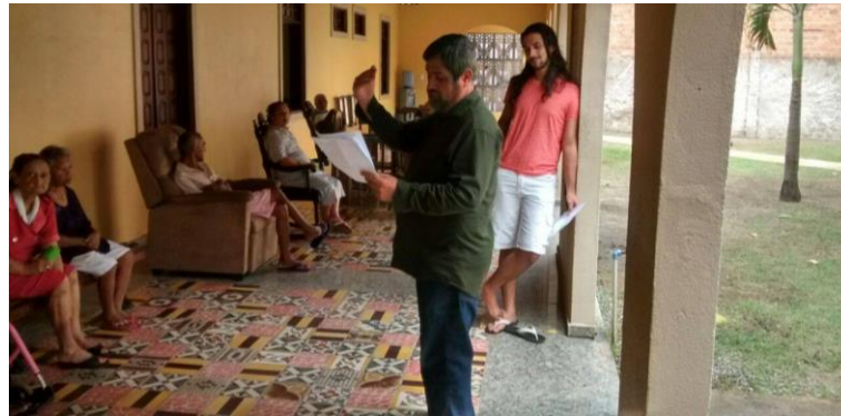
Figura A7 – Casa do Pobre