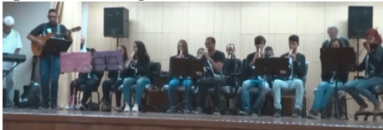
Figura B21 – Homenagem ao trabalhador terceirizado