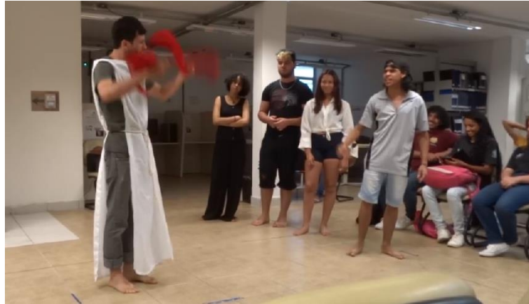
Figura B24 – Auto de Natal