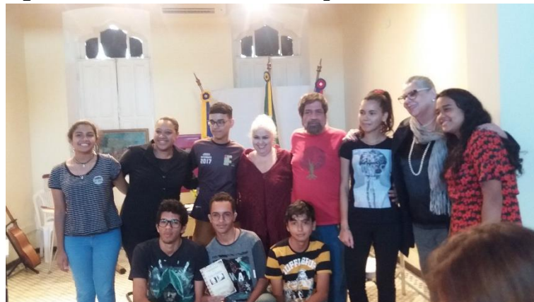
Figura B17 – Sarau na Academia Alagoana de Letras