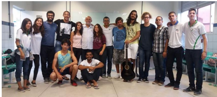
Figura B2 – Primeira oficina de teatro