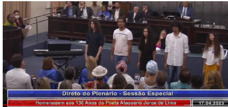
Figura B22 – Homenagem a Jorge de Lima