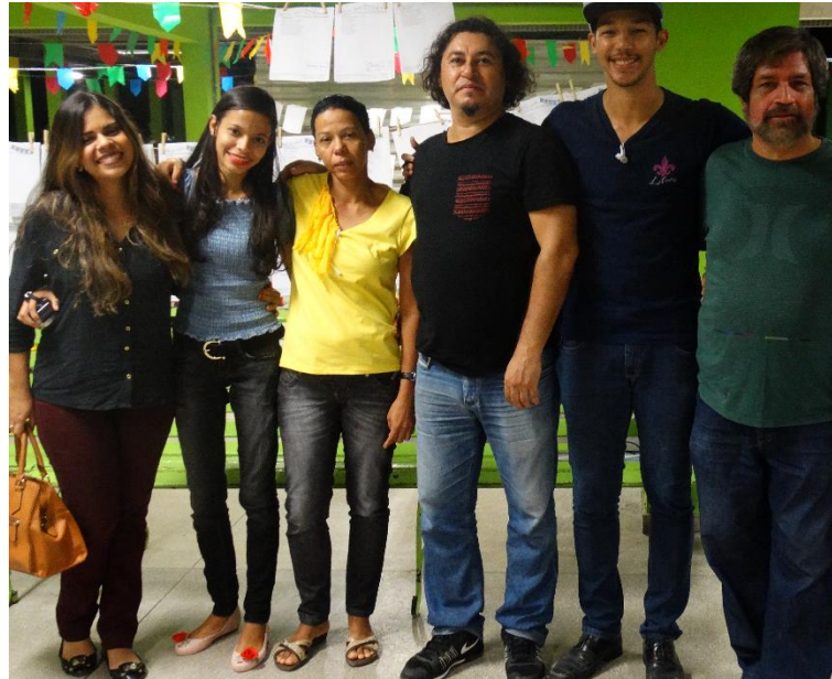
Figura A1 – Equipe Mandacaru