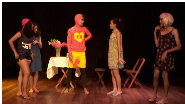
Figura B8 – Deu a louca na chapeuzinho