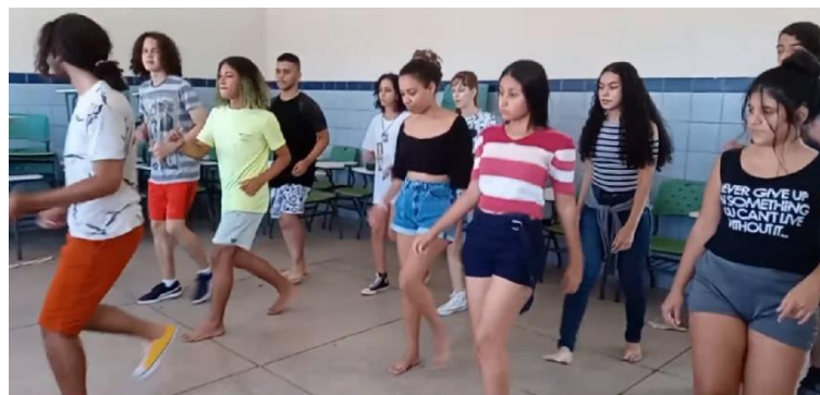
Figura B5 – Exercício teatral