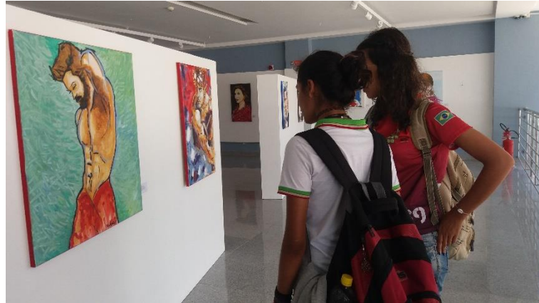
Figura B12 – Exposição de arte no anexo do Teatro Deodoro