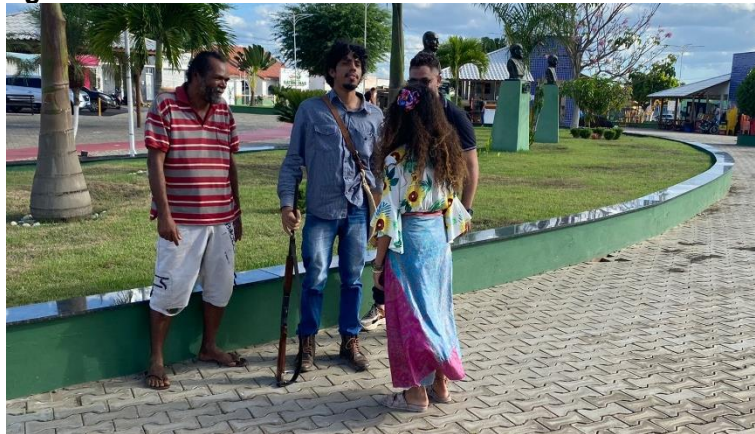
Figura B25 – A Louca