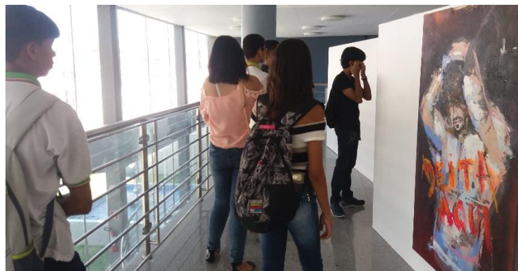
Figura B13 – Exposição de arte no anexo do Teatro Deodoro