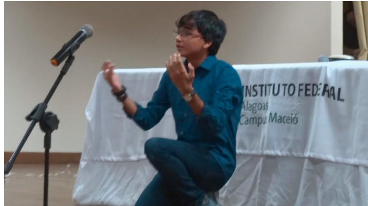
Figura B6 – Recital Drummondiano