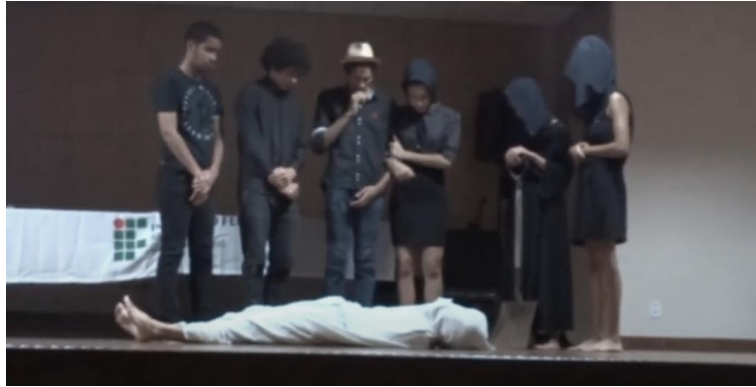
Figura B9 – Antropofagia cultural