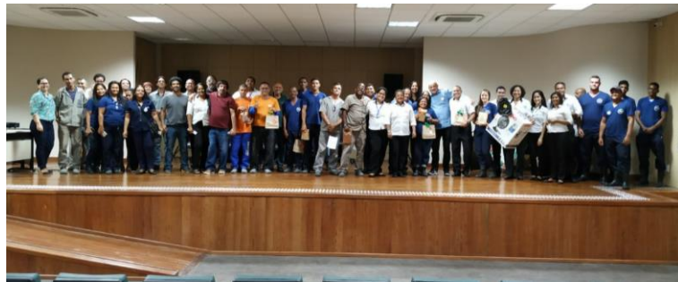
Figura B20 – Homenagem ao trabalhador terceirizado