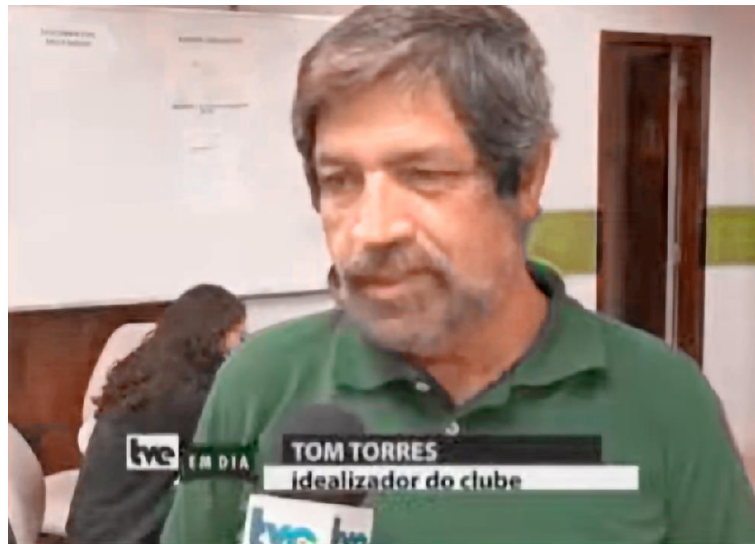
Figura A2 – Sarau poético junino (2017)