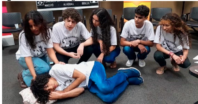
Figura B23 – Homenagem a Jorge de Lima