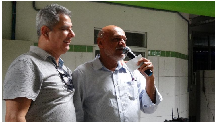
Figura A4 – Sarau poético junino