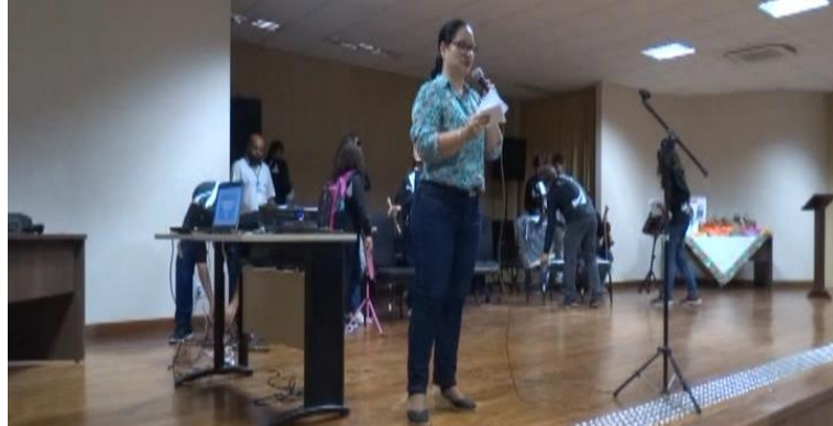
Figura B19 – Homenagem ao trabalhador terceirizado