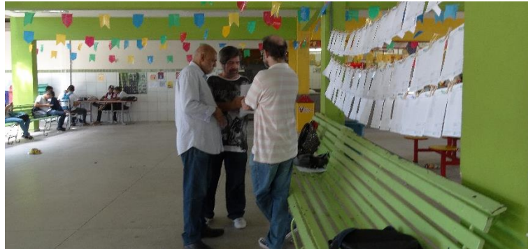
Figura A6 – Discutindo estratégia de apresentação