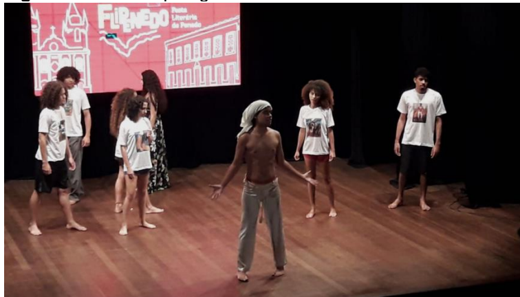
Figura B11 – Antropofagia cultural