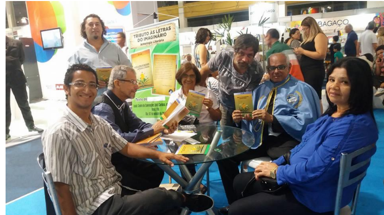
Figura A14 – Bienal