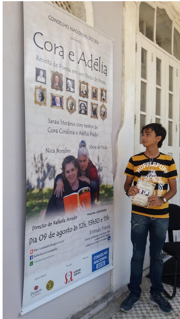
Figura B18 – Sarau na Academia Alagoana de Letras