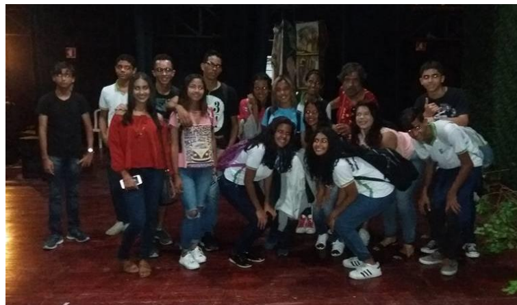
Figura B14 – Conhecendo os bastidores do T. Deodoro