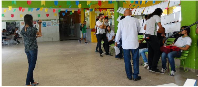
Figura A3 – Sarau poético junino