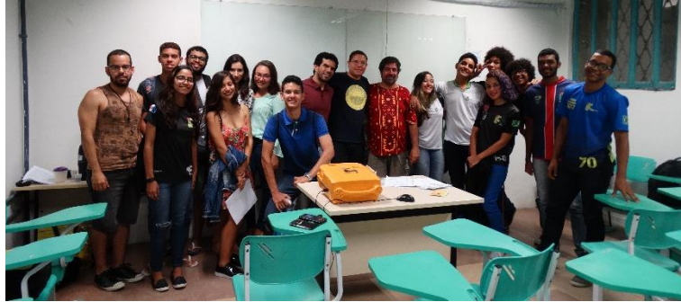
Figura B1 – Primeira reunião do grupo de teatro