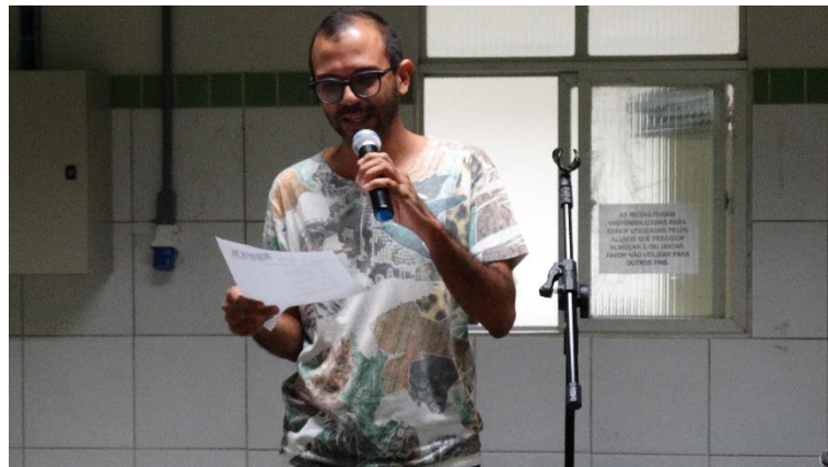
Figura A5 – Sarau poético junino