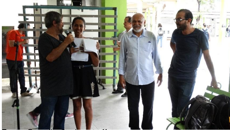
Figura A11 – Sarau poético da Primavera