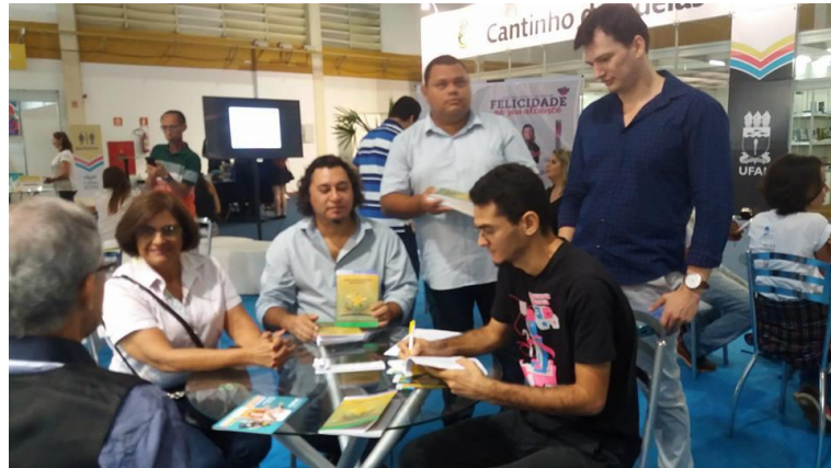
Figura A13 – Bienal 2017