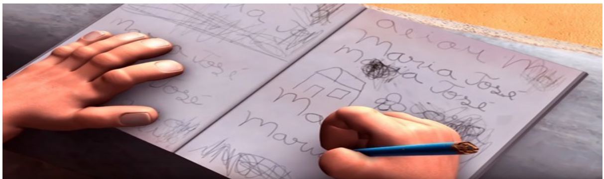
Imagem 1 – Caderno de nomes

A garota, que fazia o contorno do nome no papel, é interrompida pelos gritos insistentes da mãe. As feições de prazer, descontração e cuidado com as letras que preenche no caderno são imediatamente substituídas pelo olhar assustado e amedrontado quando sua mãe se aproxima.