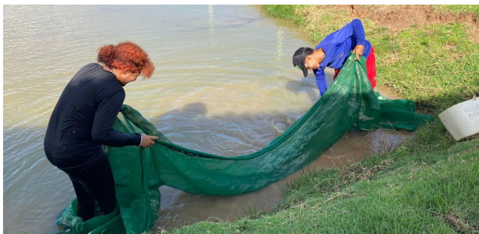
Figura 3: Processo em que as pós larvas são passadas para o balde.

Após o processo da coleta, as pós-larvas são passadas para um balde com o auxílio de uma peneira (Figura 3) e devem ser levadas imediatamente para o laboratório, diminuindo a mortalidade por falta de oxigênio. No laboratório, são postas na mesa selecionadora (Figura 4), onde irão ser classificadas por tamanho. O selecionador possui dois compartimentos, um interno feito com tela de malha maior de 4mm, e outro externo, possuindo a tela mais fina, com malha de 2mm.