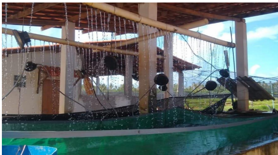
Figura 13: Tanque de depuração; Fonte (RODRIGUES, 2023)

oxigênio que é dissolvido na água antes que os alevinos sejam posteriormente transferidos ou preparados para a comercialização.