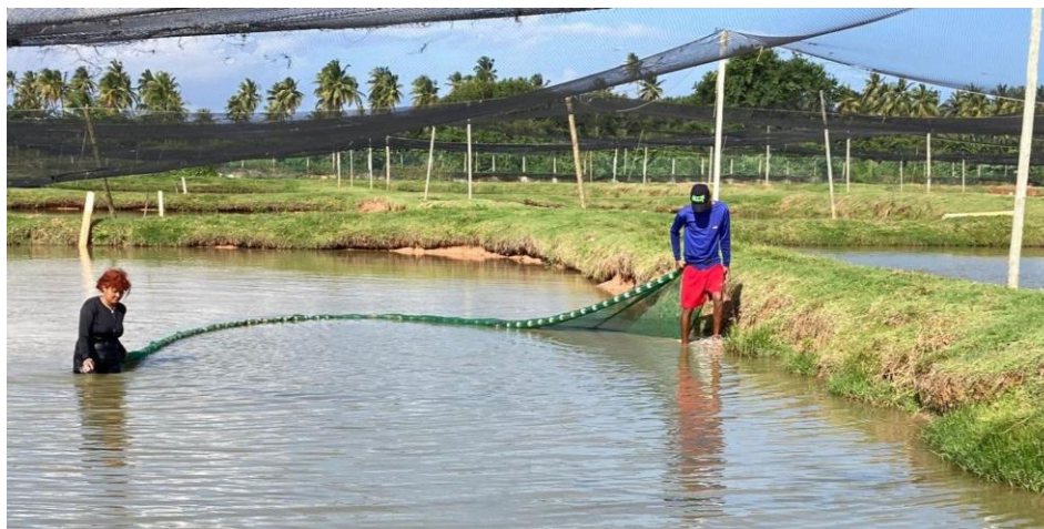
Figura 2: Realização da coleta de nuvens dos viveiros com matrizes.

Após o processo da coleta, as pós-larvas são passadas para um balde com o auxílio de uma peneira (Figura 3) e devem ser levadas imediatamente para o laboratório, diminuindo a mortalidade por falta de oxigênio. No laboratório, são postas na mesa selecionadora (Figura 4), onde irão ser classificadas por tamanho. O selecionador possui dois compartimentos, um interno feito com tela de malha maior de 4mm, e outro externo, possuindo a tela mais fina, com malha de 2mm.