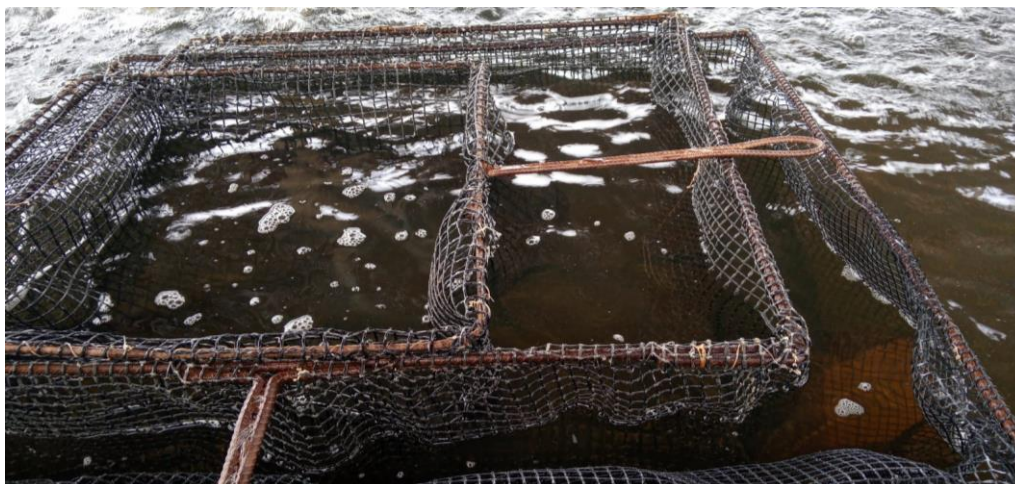
Figura 12: Grade de seleção por tamanho de Alevinos.

Durante esse processo, também é realizada a contagem média de alevinos por compartimento. É possível atingir uma quantidade aproximada de 10 mil alevinos por compartimento. Após a classificação por peso, os alevinos são transferidos para uma caixa isotérmica, onde serão colocados nos viveiros em compartimentos específicos ou preparados para comercialização. Na fase de comercialização, os alevinos são transportados em sacos plásticos com oxigênio. Isso é adequado para vendas em pequenas quantidades e em locais próximos. No entanto, para vendas em grandes quantidades e em locais distantes, são utilizados caminhões TransFish. Esses caminhões permitem o transporte dos alevinos para diferentes estados, ampliando a distribuição dos peixes.