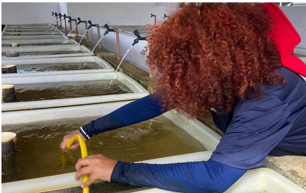
Figura 6: Realização de limpeza das bandejas feita com sucção com a utilização de uma mangueira.

Uma das técnicas empregadas para a realização da limpeza das bandejas inclui o uso da sucção, utilizando, nesse procedimento, uma mangueira (Figura 6). Para executá-lo, é necessário encher a mangueira com água e, em seguida, vedar ambas as extremidades com os dedos. Uma das extremidades da mangueira é inserida na bandeja, aspirando todos os resíduos indesejados do fundo, enquanto a outra recebe esses resíduos para posterior descarte. É importante destacar a importância de manter a torneira responsável pela oxigenação ligada durante todo o processo, evitando assim a diminuição do nível de água, o que impede a sucção das larvas.