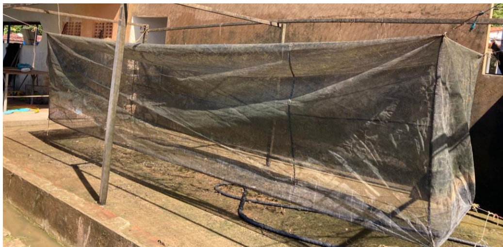
Figura 9: Hapas no suporte de hastes para a manutenção.

Após um determinado período, torna-se essencial verificar o estado das redes de pesca a fim de realizar a manutenção. O encarregado desta tarefa procede com a coleta das redes deixadas nas margens dos tanques viveiros, fazendo uso de um carrinho diariamente. As redes são então transportadas até uma área designada para a limpeza, onde quatro hastes estão disponíveis para servir como suporte (Figura 9).