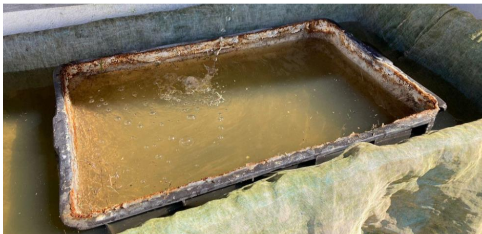
Figura 4: Mesa responsável pela seleção das pós-larvas recém coletadas.

Posteriormente é realizada a contagem de acordo com a peneira (em torno de 5 mil por peneira), sendo adicionadas em torno de 35 mil pós-larvas por bandeja, permanecendo neste local por pelo menos sete dias. Aqueles que não possuem tamanho ideal, juntamente com os pequenos alevinos desnecessários para o processo, são descartados em um local específico localizado na própria empresa.