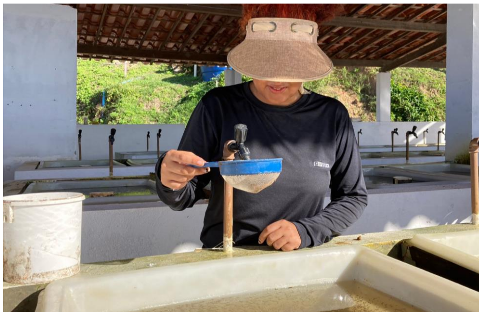
Figura 19: Aplicação da ração para pós-larvas, inseridas no laboratório.

Durante esse período, os alevinos são alimentados seis vezes ao dia com ração misturada ao hormônio. A aplicação da ração deve ser realizada do lado oposto ao filtro para evitar desperdícios. É recomendável desligar temporariamente a oxigenação durante a aplicação para evitar agitação excessiva, o que poderia dificultar a absorção da ração pelas pós-larvas, e reativá-la após alguns segundos.