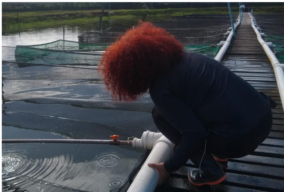
Figura 17: Manutenção de canos para a oxigenação da água.

Durante a manhã, os peixes tendem a comer mais devido a um período prolongado sem alimentação. O arraçoamento é realizado por duas pessoas, com intervalos médios de 1 hora a 1 hora e 30 minutos, tanto no laboratório e viveiros duas vezes ao dia, quanto nos reservatórios e matrizes, seguindo uma rota pelos tanques. As pessoas orientam sobre o tipo e a quantidade de ração a ser adicionada para cada tanque, utilizando uma peneira para dosar a quantidade de ração visualmente (figura 17).