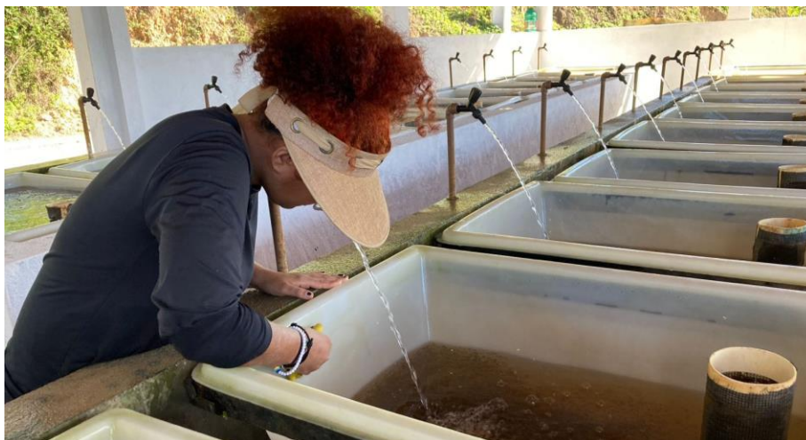
Figura 7: Realização de limpeza das bandejas utilizando a bucha.

concluir a limpeza, o cano é recolocado para que o nível de água possa ser restaurado. Se necessário, o filtro pode ser removido para uma limpeza mais detalhada. Finalmente, o filtro é devolvido ao seu local apropriado, encerrando assim o processo de higienização.