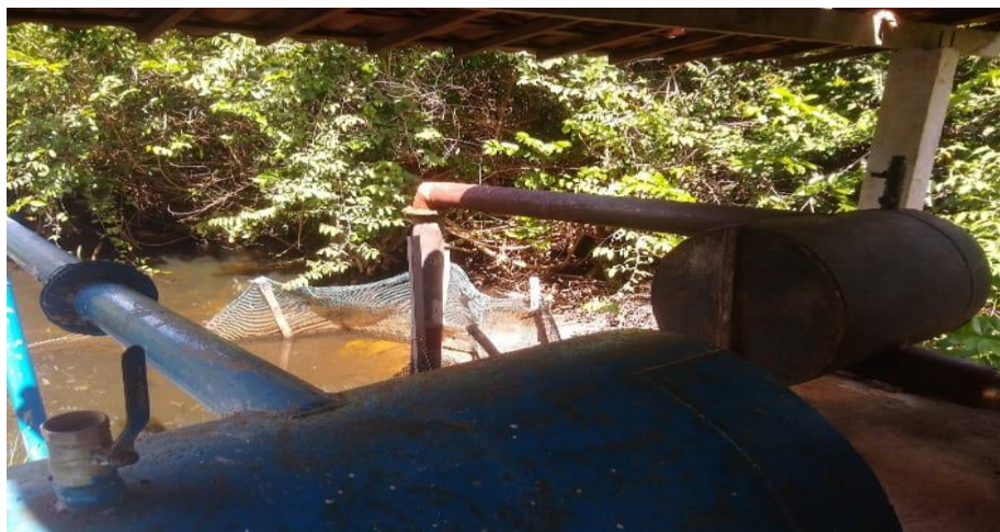
Figura 24: Motobombas responsáveis pela captação de água