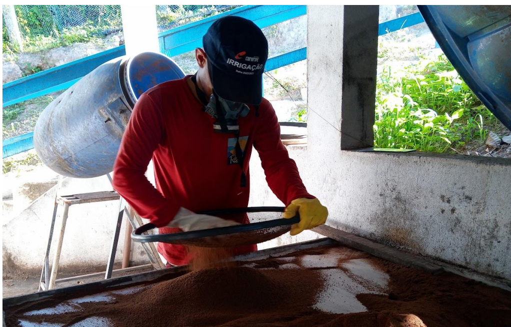
Figura 22: Peneiração do composto recém produzido.

Depois de misturar todos os elementos e garantir uma mistura homogênea, a ração recém-produzida é peneirada em uma mesa para desfazer os torrões formados durante o processo, deixando-a mais fina (figura 22).