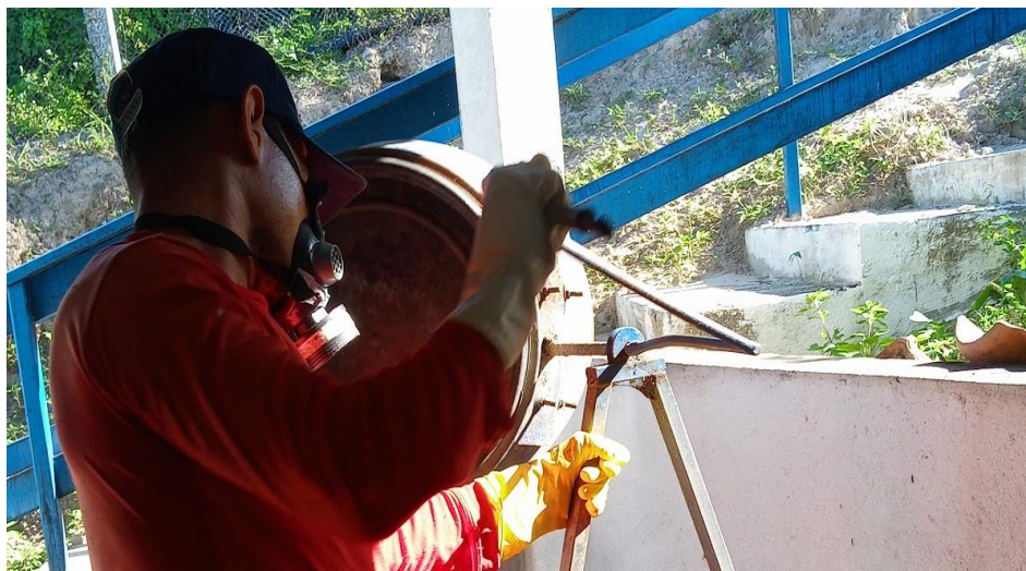
Figura 21: Aplicação dos ingredientes, e execução do preparo da ração no misturador.

Depois de misturar todos os elementos e garantir uma mistura homogênea, a ração recém-produzida é peneirada em uma mesa para desfazer os torrões formados durante o processo, deixando-a mais fina (figura 22).