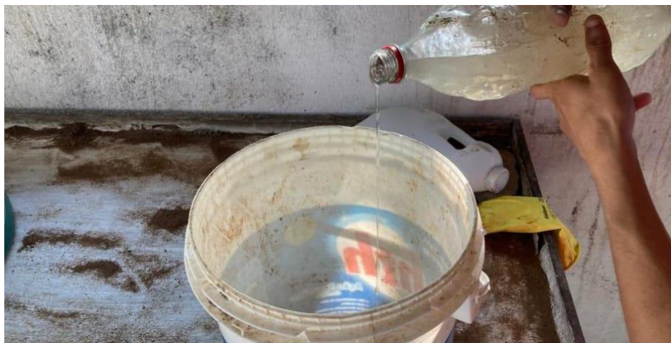
Figura 20: Processo de mistura dos principais ingredientes que compõem a ração de reversão sexual.

A realização, que geralmente é feita de 2 em 2 dias, precisa utilizar equipamentos de proteção individual, impossibilitando a ocorrência de possíveis acidentes durante o preparo, dentre eles: Máscara respiratória semifacial, luvas e avental. O seu preparo ocorre da seguinte forma: primeiramente, a água e o hormônio são misturados com a quantidade de álcool indicado, em um balde, acompanhado com os outros ingredientes (Figura 20).