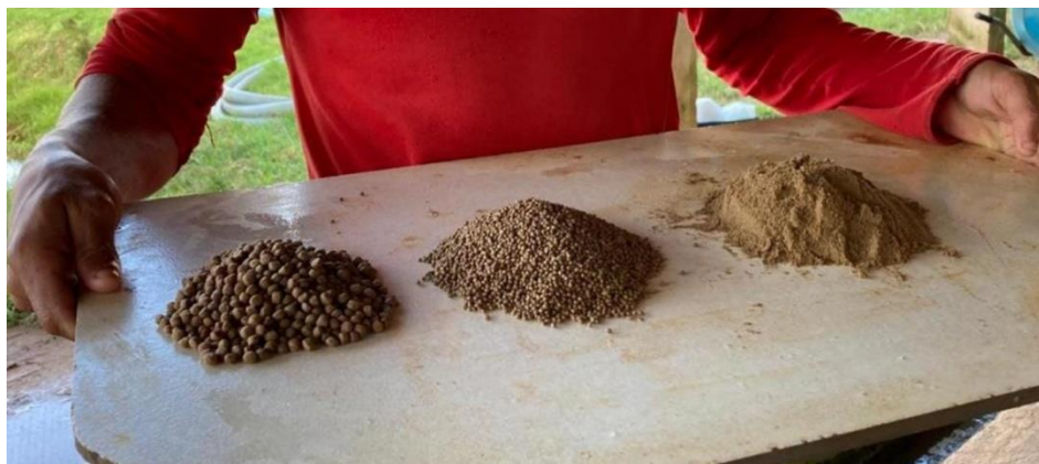
Figura 16: Demonstração dos tipos de ração utilizadas no manejo alimentício dentro da empresa, com tamanhos distintos, sendo direcionadas para cada fase de produção dos peixes. Dentre elas, a ração 4 a 6mm, a de 1,8 e a ração de masculinização misturada com o pó

Entre as rações mencionadas anteriormente, destaca-se uma de extrema importância: a ração de masculinização. Sua execução, normalmente realizada a cada dois dias, exige o uso de equipamentos de proteção individual para prevenir possíveis acidentes durante o processo. Esses equipamentos incluem máscara respiratória semifacial, luvas e avental. O procedimento de preparo consiste na combinação de água e hormônio com a quantidade recomendada de álcool em um balde, juntamente com outros ingredientes. Em seguida, essa mistura é colocada em um misturador contendo um saco de pó de 20kg, sendo agitada com movimentos circulares por aproximadamente 5 a 10 minutos.