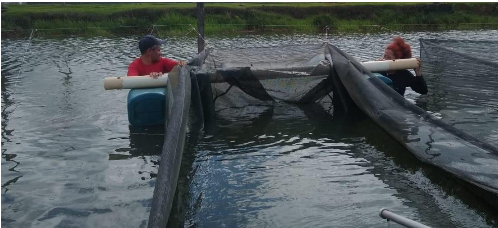
Figura 8: Boias feitas de bujões.