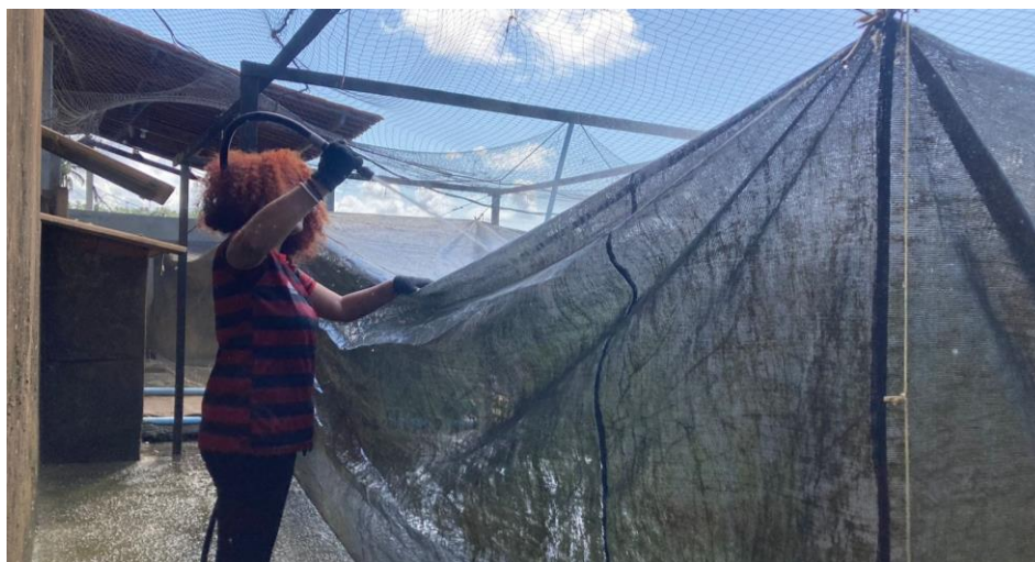
Figura 10: Jato de alta potência utilizado na limpeza de hapas.

Após o processo de limpeza e revisão, as redes são dobradas e armazenadas, a menos que seja necessário posicioná-las nos viveiros.