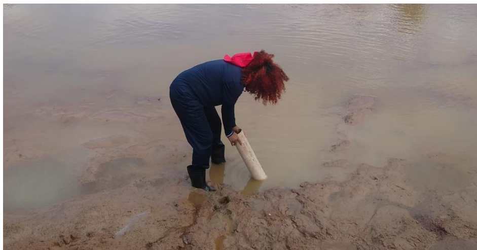
Figura 14: Canal de escoamento do tanque.

As formas de desinfecção adotadas pela empresa são a utilização de cal, virgem ( \text{CaO} ) ou hidratada ( \text{Ca(OH)}_2 ), e o calcário que além de corrigir o pH, corrige também a alcalinidade total, entretanto, deve ser aplicado em uma dose adequada para equilibrar a água do viveiro. Essa dose dependerá da qualidade da água do abastecimento e da acidez do solo. Por conta disso, para chegar à dose ideal, a alcalinidade total da água do abastecimento deve ser medida.