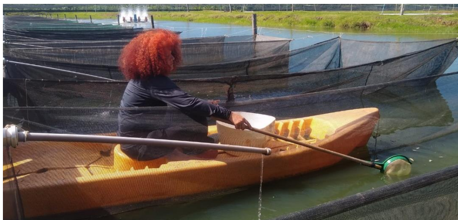
Figura 11: Caiaque utilizado para recolher os alevinos mortos.

Também é necessário coletar diariamente os alevinos que morreram devido a lesões graves que não puderam cicatrizar. Para essa tarefa, são usados equipamentos adaptados, como peneiras presas a cabos e baldes para a coleta dos peixes mortos. Em casos em que as hapas estão distantes da passarela, um caiaque é utilizado para melhor alcançar os alevinos mortos (Figura 11).