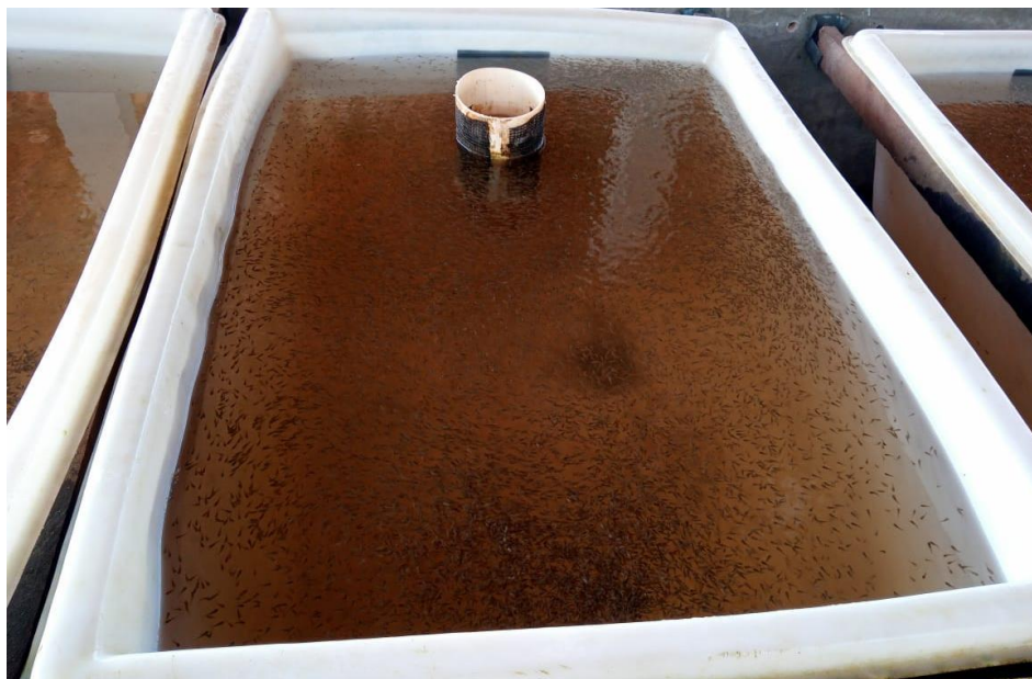
Figura 5: Bandeja utilizada no laboratório de masculinização.

A alimentação é efetuada diariamente no mesmo horário, com uma quantidade específica de ração misturada com o hormônio em pequena quantidade para que não haja acúmulo de ração e para que a mesma não venha a apodrecer. Tal técnica é fundamental para o cultivo racional da tilápia, uma vez que a obtenção de indivíduos machos para engorda é de extrema importância, pois tendem a crescer mais rápidos que as fêmeas e são mais valorizados no mercado. A empresa realiza apenas a reprodução, a engorda é feita em um outro centro.