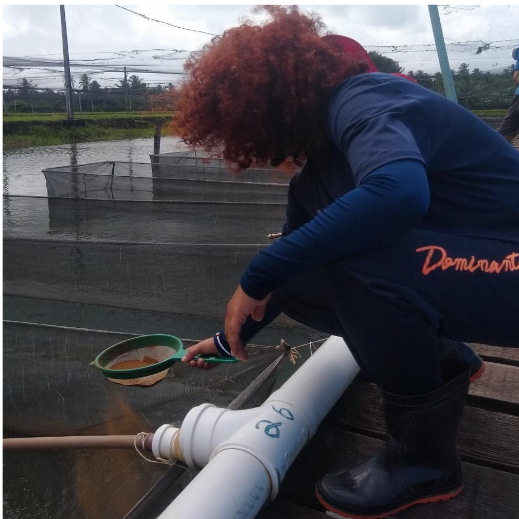
Figura 18: Aplicação da ração de masculinização nas hapas, inseridas no viveiro.

Após introduzir as pós-larvas no laboratório, é recomendado fornecer uma quantidade reduzida de ração nos primeiros dias, devido ao breve período desde a coleta e à falta de familiaridade com o alimento (figura 19). É importante aplicar uma quantidade adequada para que as pós-larvas possam consumir até o próximo arraçoamento, evitando sujeira nos tanques, obstruções ou contaminações com o excesso de ração.