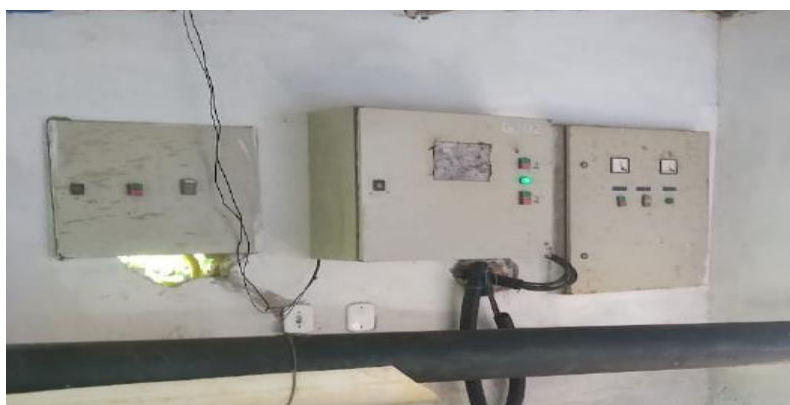
Figura 25: Painel de controle para acionamento localizado dentro casa de bombas;