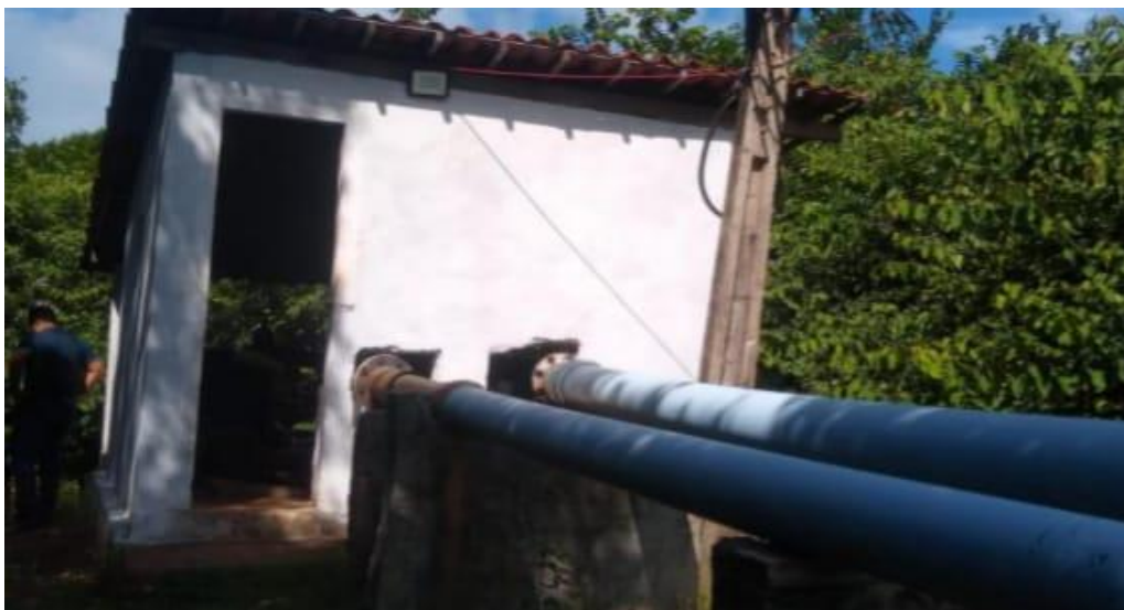
Figura 23: Casa de bombas