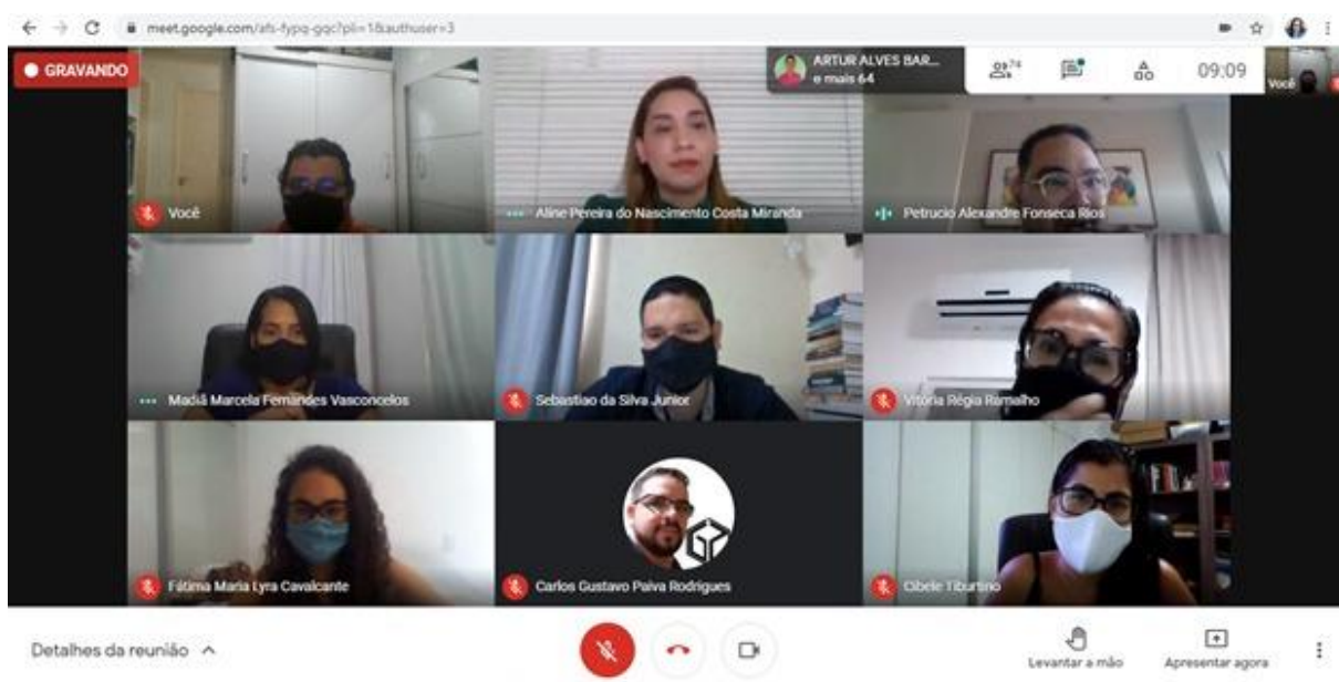
Fig 1 – Reunião com os Professores para Decisão da Atividade extensionista

Apenas complementando o que foi dito anteriormente os contatos diretos com os alunos, consideradas de certa forma entrevistas diretas com os alunos, não foi utilizado questionário, pois além de não ter a pesquisa sido submetida a um comitê de ética. Tanto que para efeitos de figuras, os alunos só tiveram os seus avatares à mostra, jamais de câmera aberta.