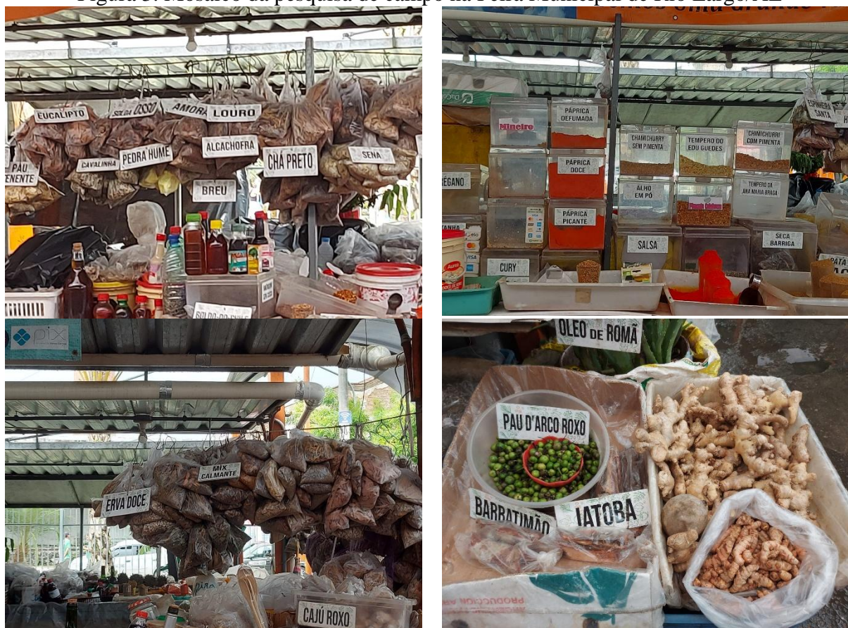
Figura 3. Mosaico da pesquisa de campo na Feira Municipal de Rio Largo/AL

O trabalho foi desenvolvido junto à instituição que disponibilizou seu espaço para a realização da intervenção pedagógica. Para obter melhores resultados, foi pensada uma palestra referente ao tema alimentação saudável consubstanciada a partir de pesquisa de campo na feira municipal (ver figura 3) em que a escola encontra-se localizada.