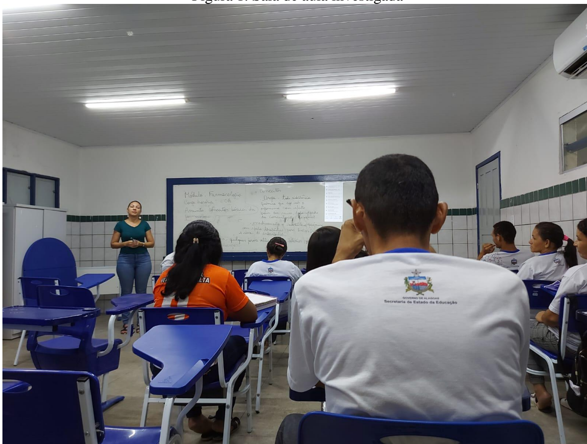
Figura 1. Sala de aula investigada

Os processos de ensino e aprendizagem que corroboram para a formação discente-profissional no âmbito da Educação de Jovens e Adultos (EJA) são decorrentes de programas e políticas educacionais como PROEJA, ou seja, produtos de lutas sociais por direito à educação pública socialmente referenciada que contribua para que jovens, adultos e idosos compreendam o mundo que está a sua volta e com ele possam conviver (ver figura 1).