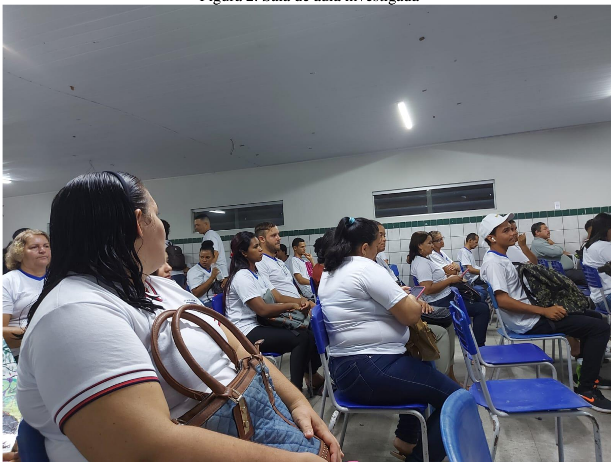
Figura 2. Sala de aula investigada

Na trilha deste estudo associaram-se à pesquisa qualitativa as pesquisas bibliográficas, documental e de campo, tendo a escola-referência a Escola Estadual Fernandina Malta objetivando compreender e valorizar as especificidades do trabalho pedagógico no curso EJA do Ensino Médio por meio da intervenção pedagógica no curso de Auxiliar de Farmácia na disciplina Farmacologia (ver figura 2).