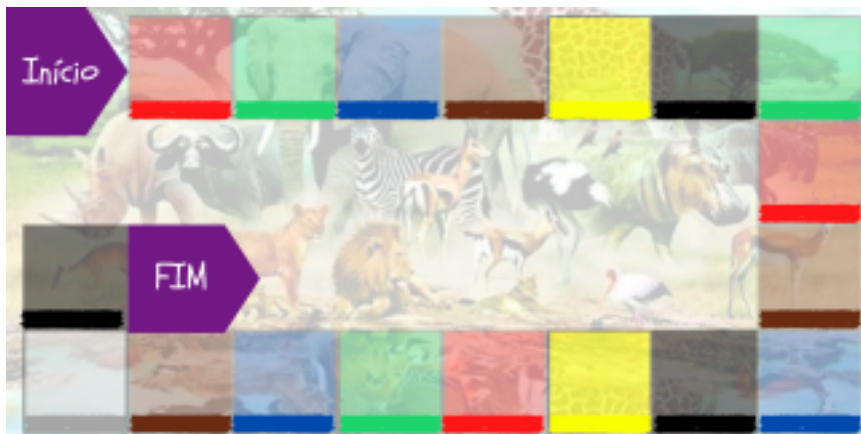
Imagem 1: Protótipo do tabuleiro para o jogo Corrida Zoológica Sustentável

revelação, sendo peixes representados pela cor azul, anfíbios representados pela cor verde, répteis representados pela cor marrom, aves representados pela cor amarela, mamíferos representados pela cor vermelha, sustentabilidade representada pela cor cinza e cor preta para representar a casa segredo