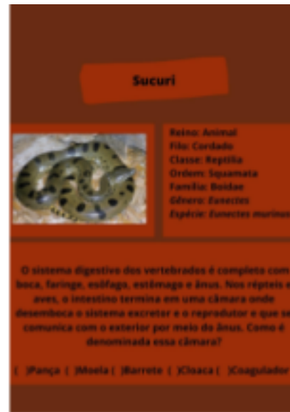
Imagem 5: Protótipo da carta pergunta referente aos réptil..

Para marcação dos jogadores nos tabuleiros, foram pensados peões customizados com tampa de creme dental e tinta guache de cores distintas, o dado para decidir cada movimento será confeccionado com papelão e piloto de cor preta e para comandar o tempo da partida, uma pessoa que não esteja jogando será responsável pelo cronômetro. Os materiais utilizados para confecção deste jogo podem ser adaptados de acordo com a realidade do professor.