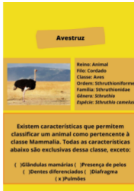
Imagem 3: Protótipo da carta pergunta referente às aves.

Para interpretar as cartas é necessário saber que as 150 cartas coloridas contém uma pergunta, com a resposta grafada, sobre uma classe do filo chordata (exemplo: a carta de cor vermelha contém uma pergunta sobre mamífero), as 50 cartas pretas revelam algum comando, podendo ser uma pergunta sobre qualquer classe do filo chordata, bonificação caso o jogador acerte a questão, caso contrário ganhará um comando de punição.