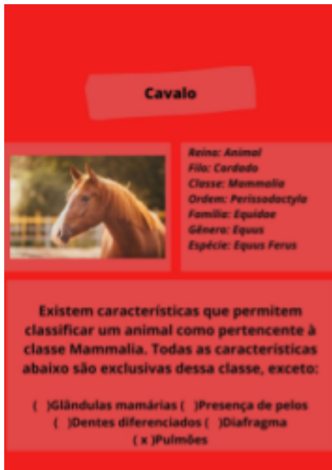
Imagem 2: Protótipo da carta pergunta referente aos mamíferos.