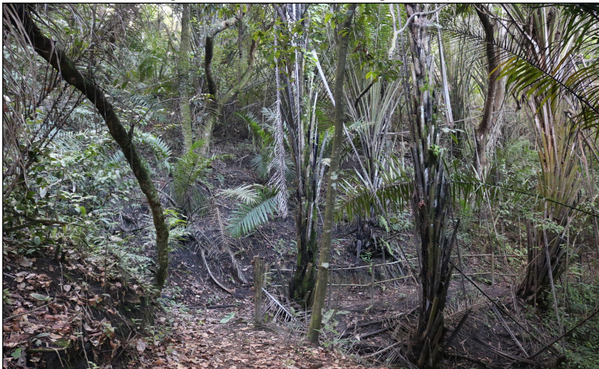
Figura 9 - Curva do dendê ( Elaeis guineensis )