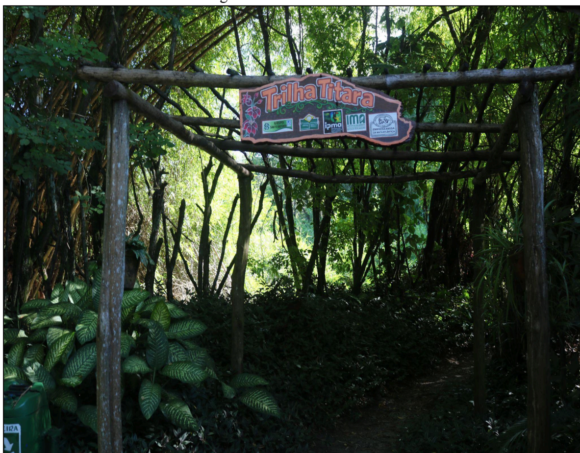
Figura 3 - Entrada da trilha.

No que se refere ao primeiro ponto (Figura 3), corresponde à entrada na trilha. É falado como os visitantes devem se portar diante da trilha para não ocasionar acidentes. As placas de entrada desta trilha devem ser bilíngues, redigidas em português e inglês, com o objetivo de apresentar aos visitantes, de forma clara, informações essenciais como: distância, tempo estimado de percurso, nível de esforço físico exigido, atrativos ao longo do trajeto e a sinalização adotada. Além disso, devem conter orientações sobre normas de uso e dados de segurança, como contatos de emergência, incluindo o Serviço de Atendimento Móvel de Urgência (SAMU), Corpo de Bombeiros, Polícia e administração da unidade (ICMBio, 2023).