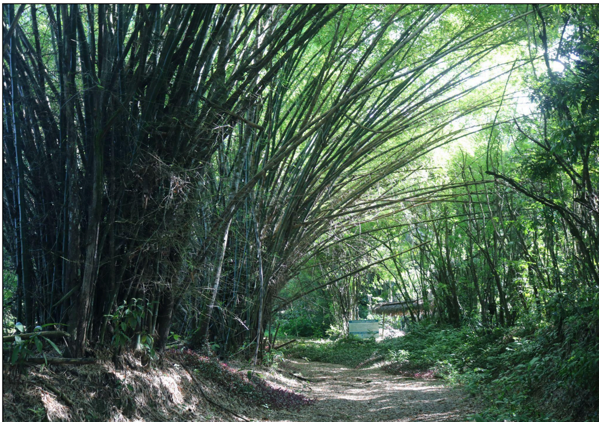
Figura 12 - Bambus ( Bambusa vulgaris )