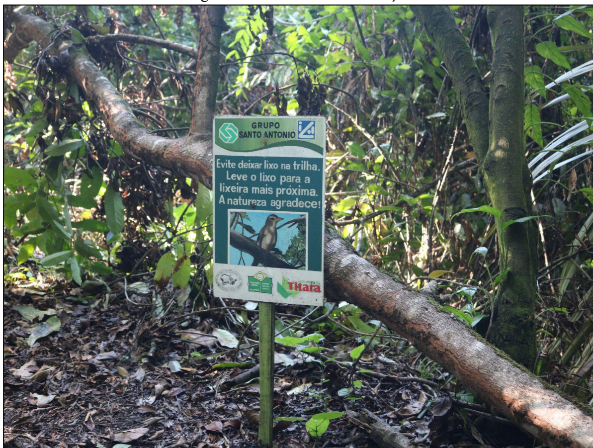
Figura 6 - Placa de conscientização