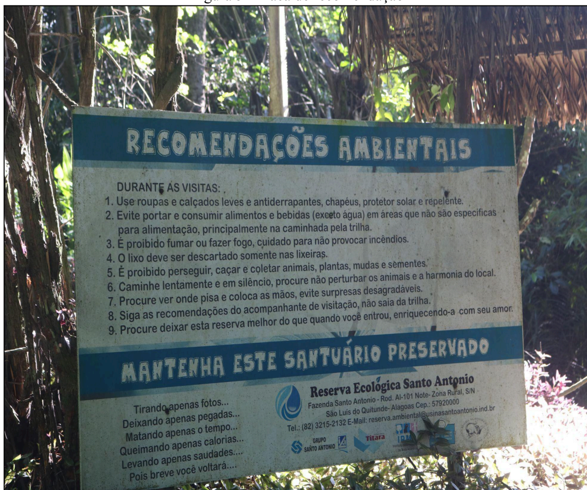
Figura 5 - Placa de recomendação

Quanto ao terceiro ponto (Figuras 5 e 6), este possui placa de recomendação e de conscientização ambiental, as quais são fundamentais para garantir medidas de segurança para os visitantes e para a preservação da reserva. Entre as informações presentes na placa, há indicação de que é necessário estar vestido com roupas leves e calçados antiderrapantes, além de utilizar chapéu, protetor solar e repelente para proteção contra o sol e insetos. Durante o percurso, é permitido levar apenas água para hidratação, é estritamente proibido fumar, acender fogueiras ou coletar qualquer elemento natural, como: plantas, animais, sementes ou mudas de plantas, pois essas ações podem desequilibrar o ecossistema. É necessário manter silêncio durante a caminhada, a fim de evitar perturbações à fauna local. Recomenda-se que os animais sejam observados à distância, sem que interfira em seus comportamentos. Ademais, é fundamental seguir rigorosamente as orientações do guia, permanecendo estritamente nos limites da trilha, o lixo deve ser descartado exclusivamente nas lixeiras disponíveis, sendo proibido deixá-lo durante todo o percurso da trilha.