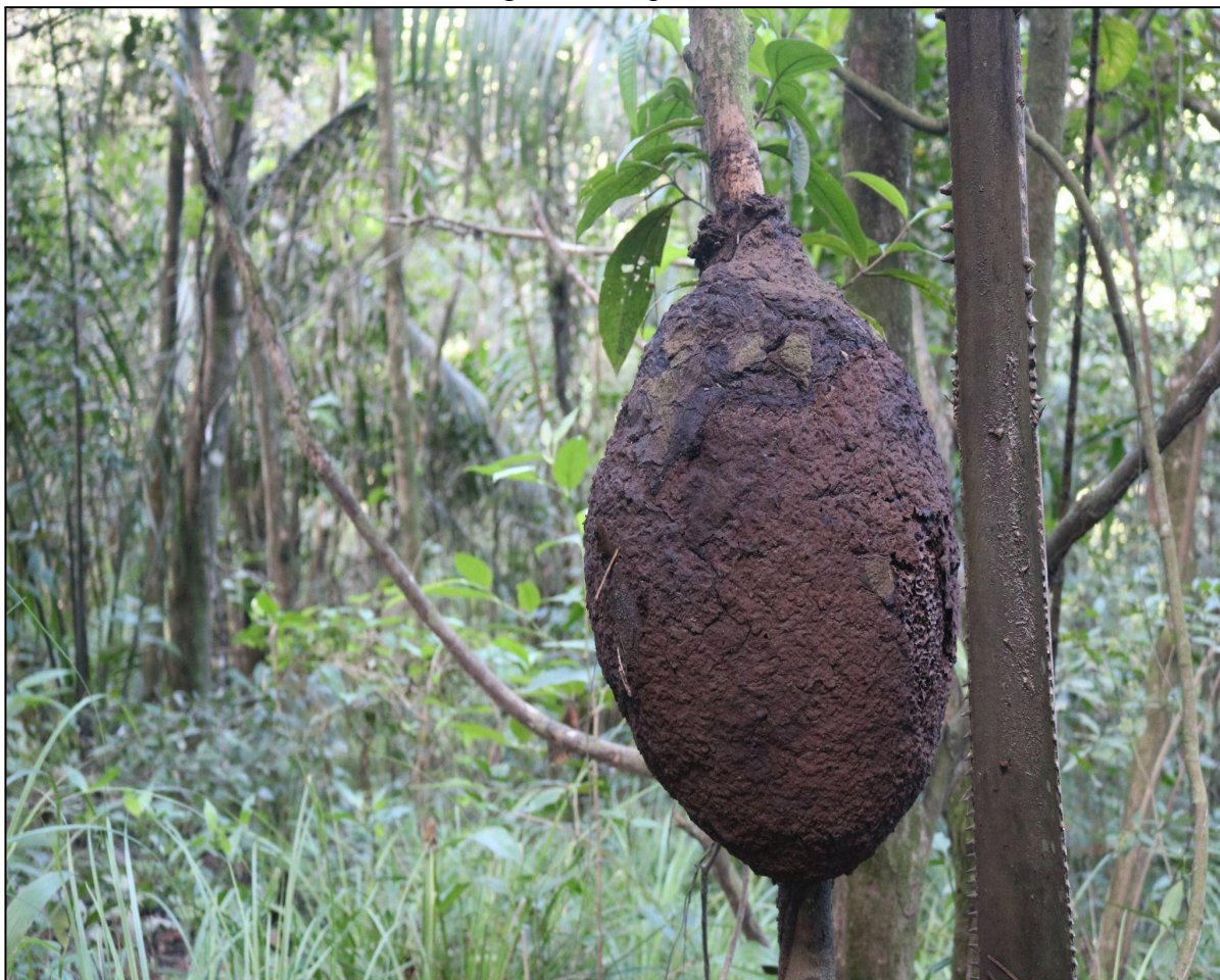
Figura 8 - Cupinzeiro