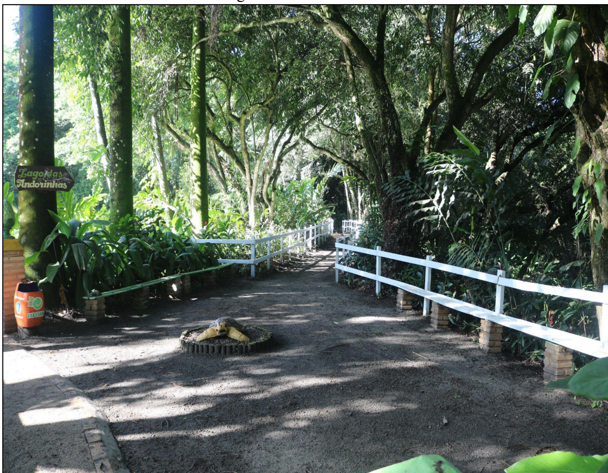
Figura 10 - Final da trilha