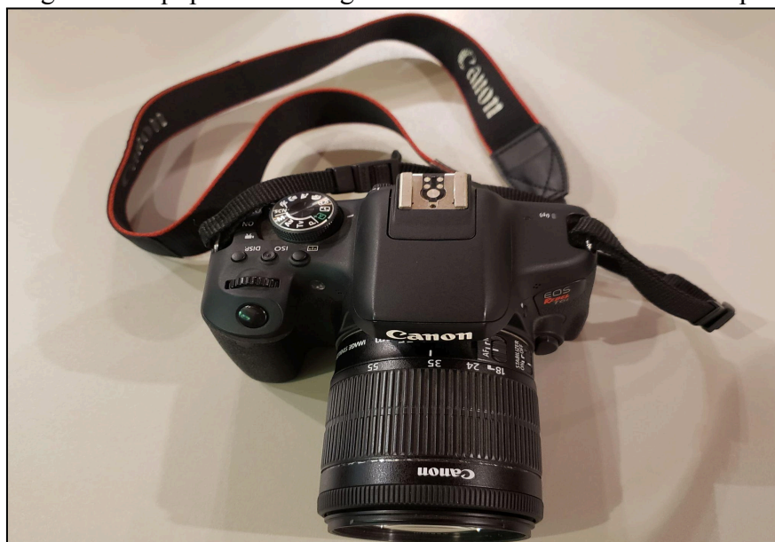
Figura 1 - Equipamento fotográfico utilizado nas visitas de campo.