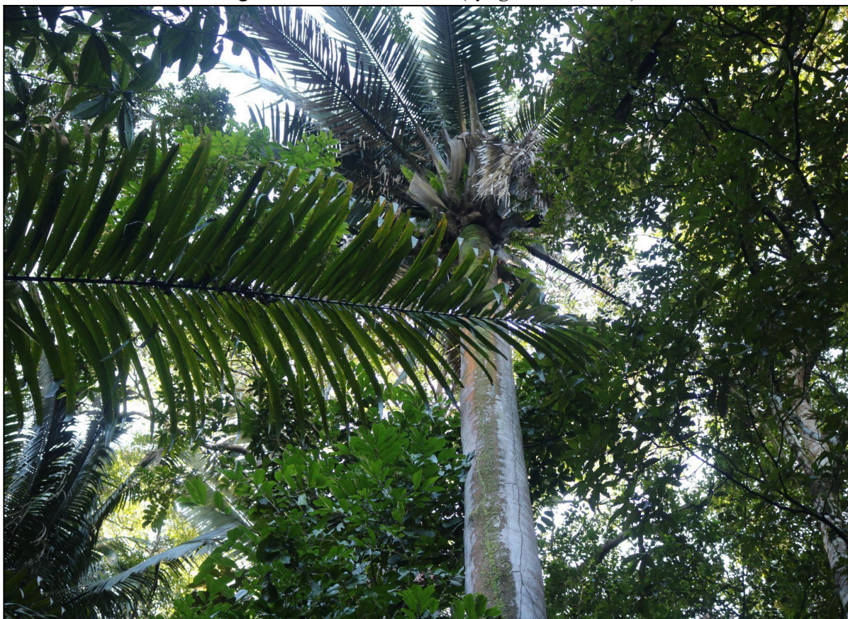
Figura 11 - Árvore Catolé ( Syagrus cearensis )

contraste marcante entre a homogeneidade da paisagem e a complexidade da floresta tropical circundante, servindo como exemplo didático para debater os impactos de espécies invasoras e a importância da restauração ecológica. Já os bambus, trata-se de uma espécie de planta que possui um crescimento rápido, originária da Ásia tropical, em especial da China e da Índia e que foi amplamente disseminada em diversas regiões de clima tropical. Do ponto de vista ecológico o bambu desempenha funções importantes nos ecossistemas a qual foi introduzido, seu sistema radicular denso e superficial contribui significativamente para o controle da erosão do solo, estabilizando margens de rios e encostas. No entanto, a ocorrência dessa espécie pode gerar um desequilíbrio ecológico por estar competindo com a flora nativa e dificultando os processos de regeneração natural da vegetação nativa (DRUMOND; WIEDMAN, 2017). Portanto, embora ofereça uma série de atributos positivos relacionados à conservação do solo oferecendo biomassa rápida, firmeza, entre outros. É necessário o cuidado no manejo dessa espécie “invasora” para priorizar e preservar as espécies nativas para garantir a integridade ecológica do bioma. Esses casos ilustram a necessidade de integrar à trilha conteúdos que abordem a ameaça dessas “plantas exóticas” e seu manejo, incentivando a reflexão e a valorização de espécies nativas.