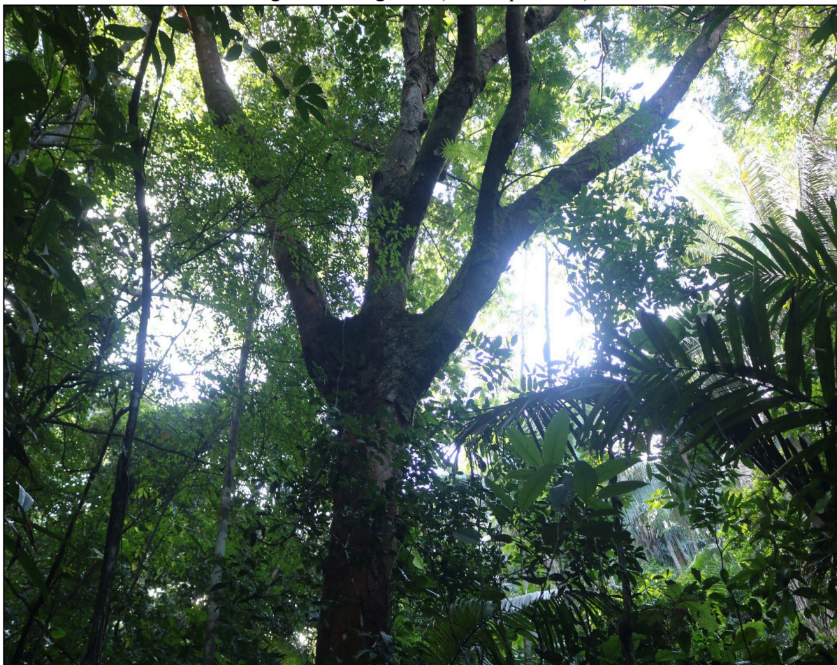
Figura 7 - Visgueiro ( Parkia pendula )

de conservação para a preservação de espécies-chave em ecossistemas ameaçados, ao exemplo da Mata Atlântica alagoana, onde a pressão antrópica exige estratégias integradas de manejo e educação ambiental.