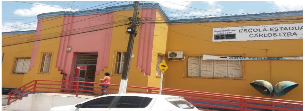
Figura 1 Frente da escola

A Escola Estadual Carlos Lyra 1 está localizada à Rua Poeta João Pinheiro, s/n–centro, município de São José da Laje, estado de Alagoas, ficando a mesma situada em área de fácil acesso no centro da cidade, tendo em sua frente uma praça onde os alunos se concentram antes do início das aulas. A escola foi criada no governo do Interventor Bacharel Osmair Loureiro em julho de 1935, autorizada pelo governador acima citado e pelo Secretário de Educação e Cultura da época, o Escritor Graciliano Ramos. É uma instituição própria de educação escolar pertencente à Rede de Ensino Oficial do Estado, mantido pelo governador do Estado de Alagoas e subordinada técnica e administrativamente à secretaria de Estado da Educação e do Esporte – SEE, sob jurisdição da 7ª Coordenadoria Regional de Ensino – 7ª CRE, com sede no município de União dos Palmares - AL.