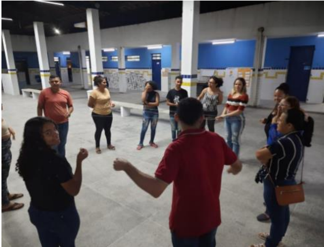
Foto 1 - estudantes da EJA em uma aula dinâmica, visando promover interação e trabalho em equipe.