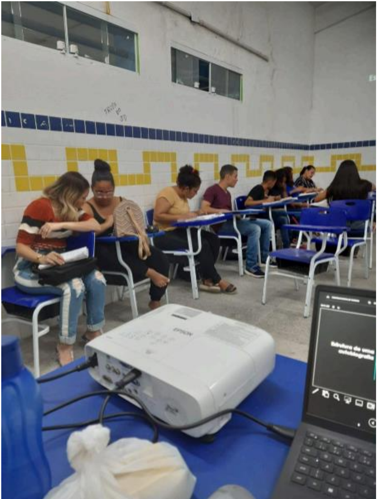
Foto 2- Estudantes participando de uma atividade dinâmica em sala de aula.