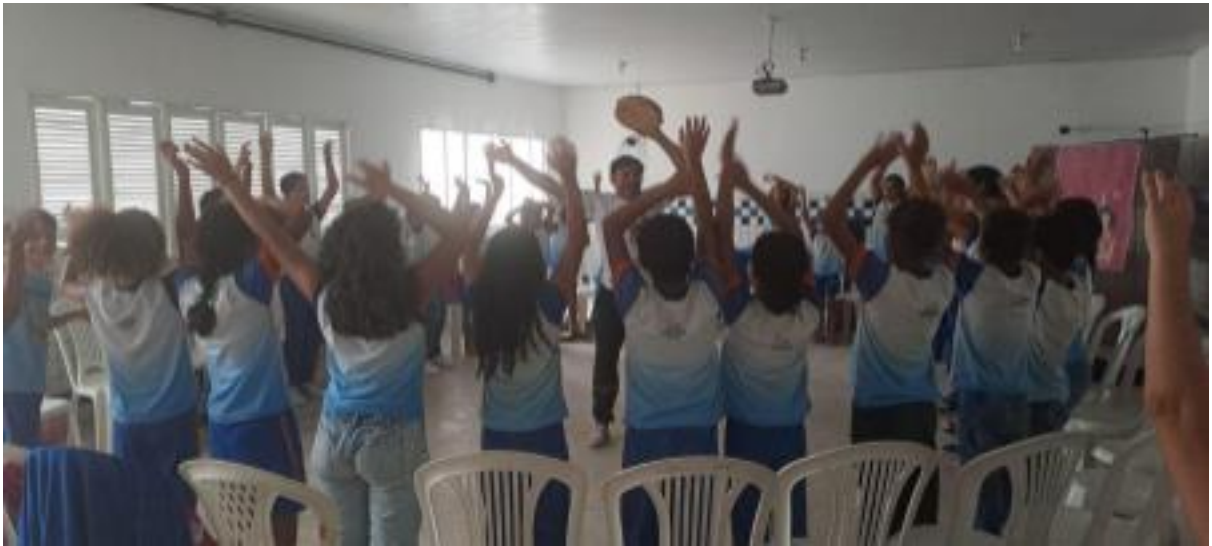
Foto 7 -Alunos desenvolvendo habilidades comunicativas em atividade em grupo.