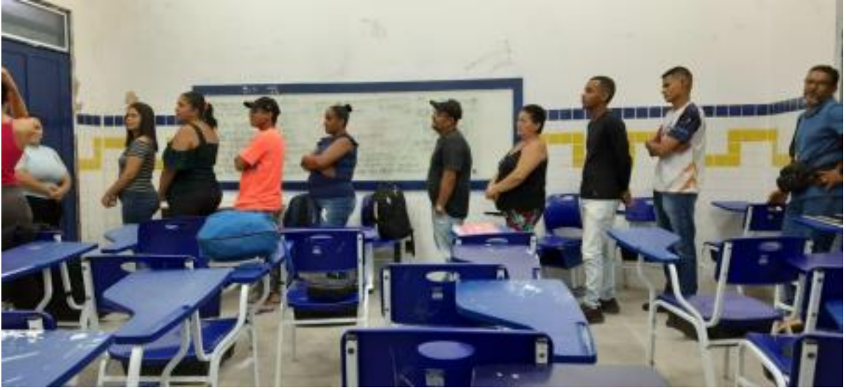
Foto 9 - Estudantes colaborando na resolução de uma proposta didática.