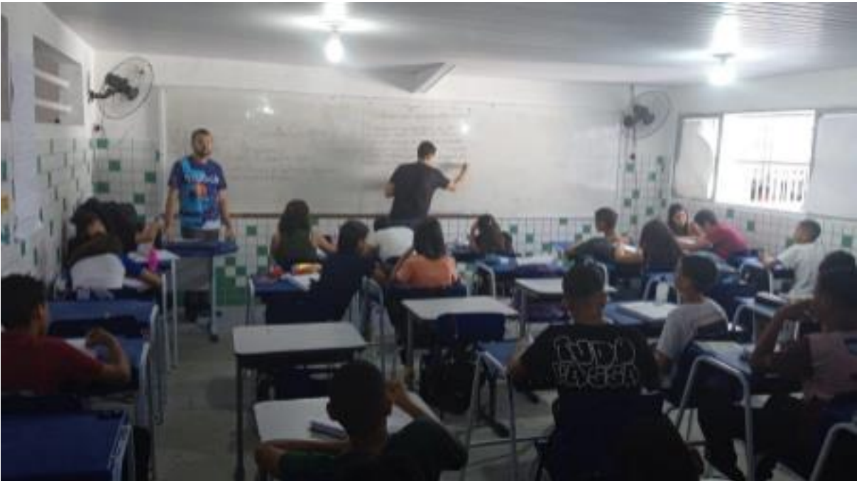
Foto 6- Aula prática voltada à construção de conhecimento de forma colaborativa.