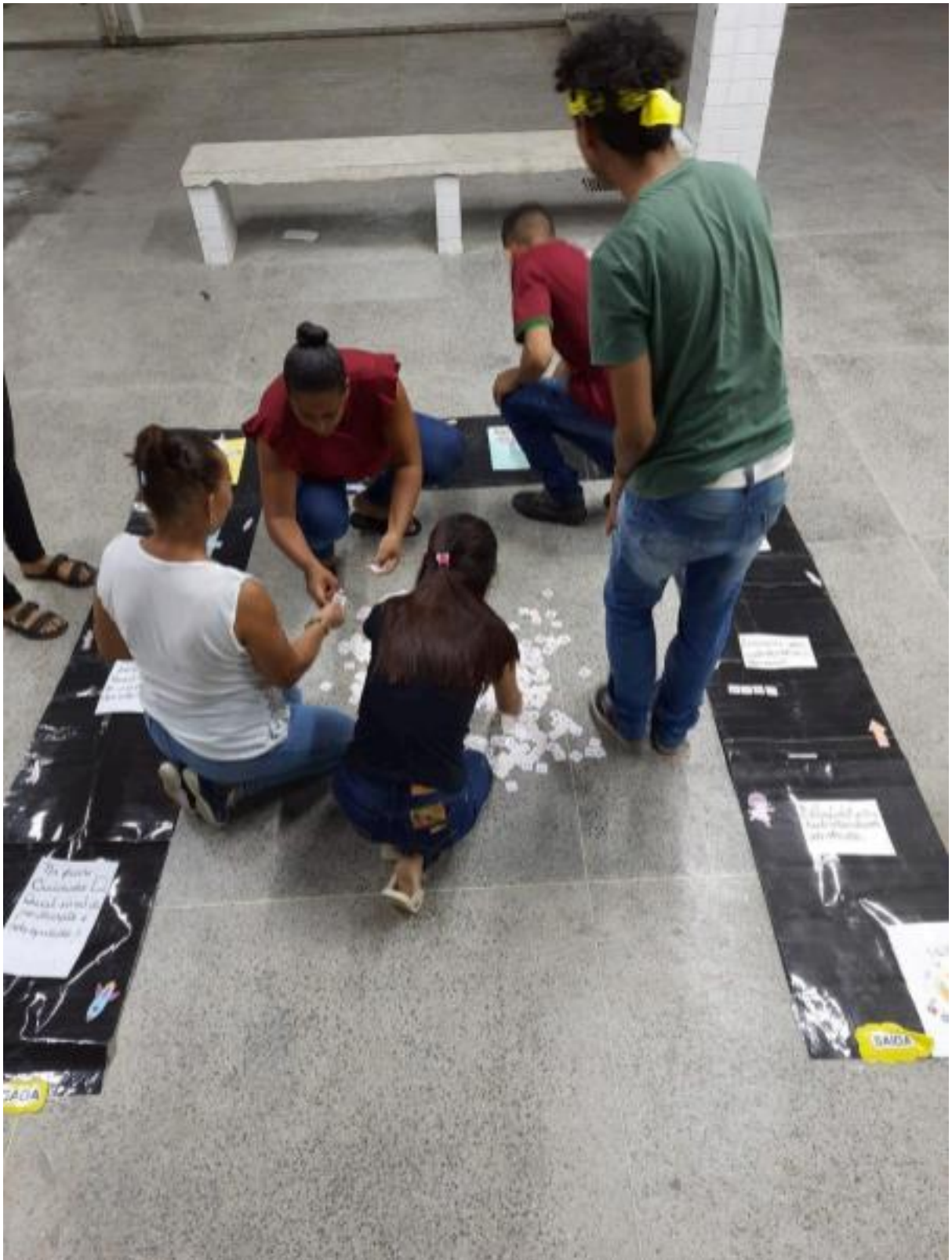
Foto 4- Registro da prática pedagógica com enfoque participativo.