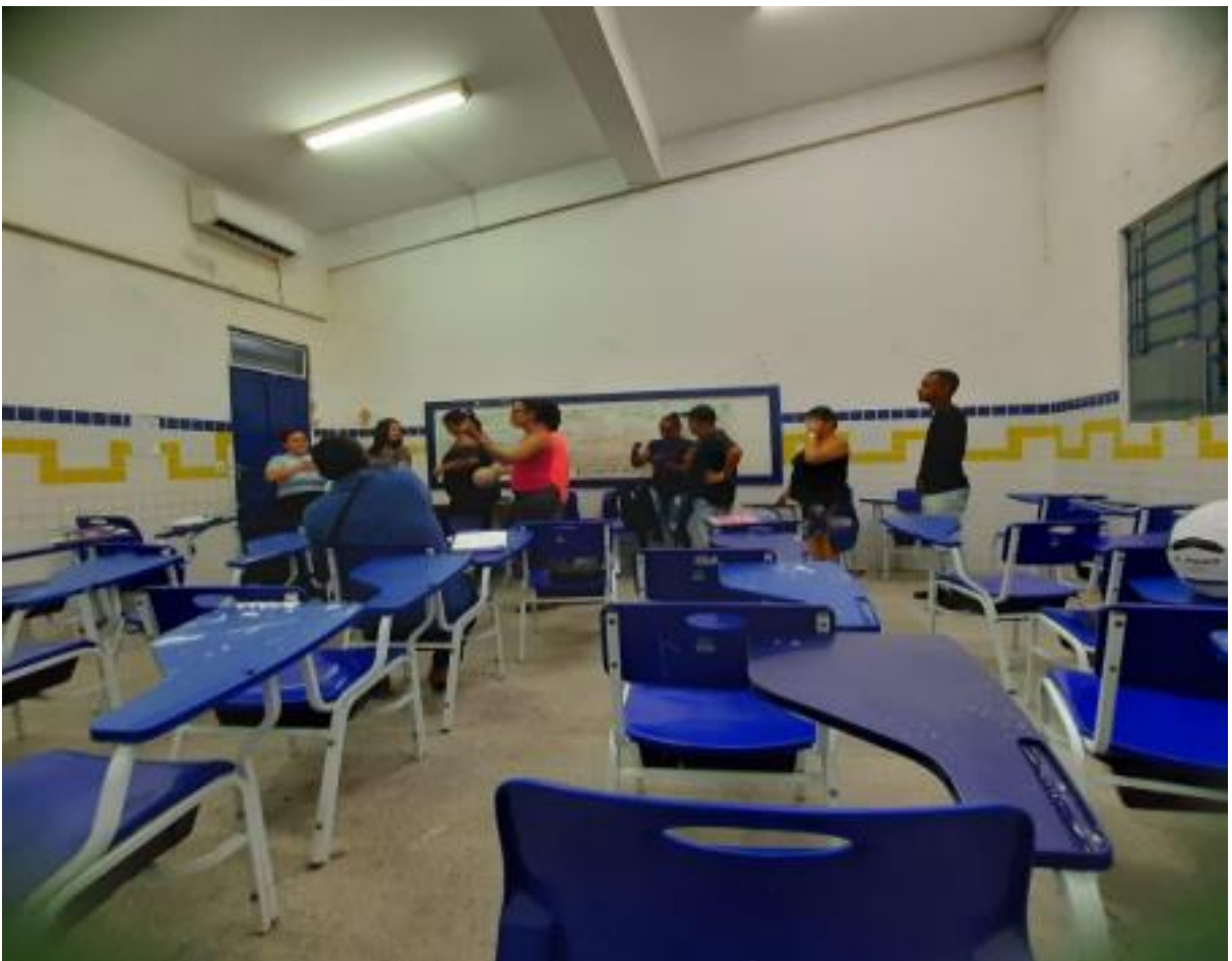
Foto 10 - Estudantes colaborando na resolução de uma proposta didática.