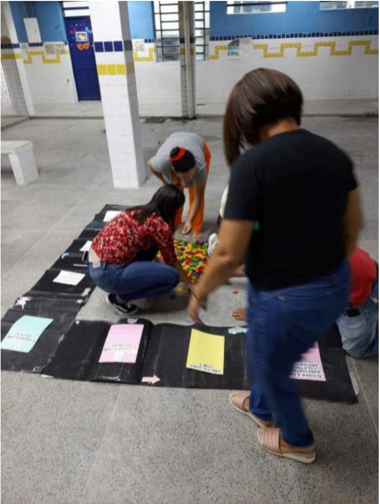
Foto 3- Estudantes participando de uma atividade dinâmica no pátio, aprendendo sobre as classes gramaticais.