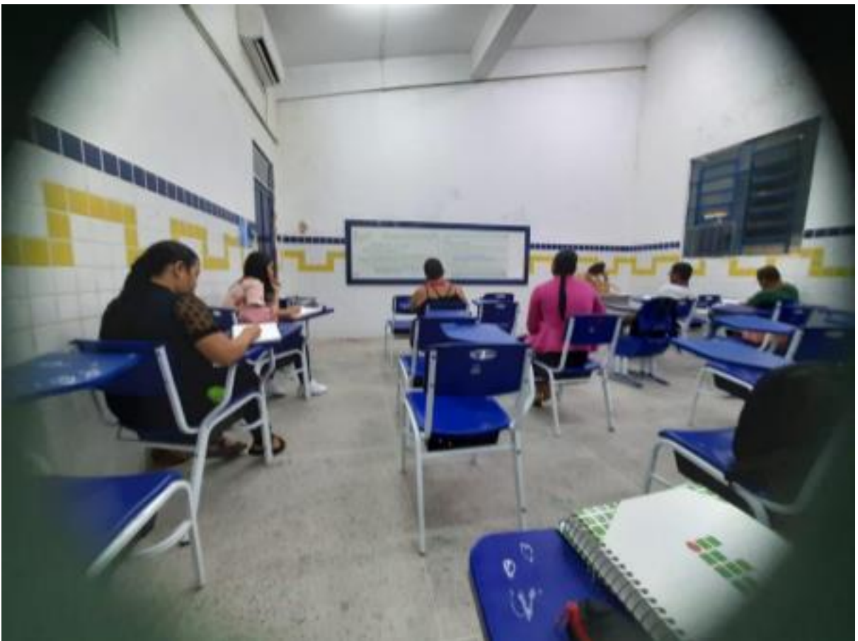
Foto 8 -Estudantes colaborando na resolução de uma proposta didática.