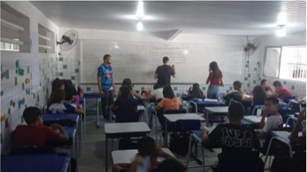
Foto 5- Aula prática voltada à construção de conhecimento de forma colaborativa.