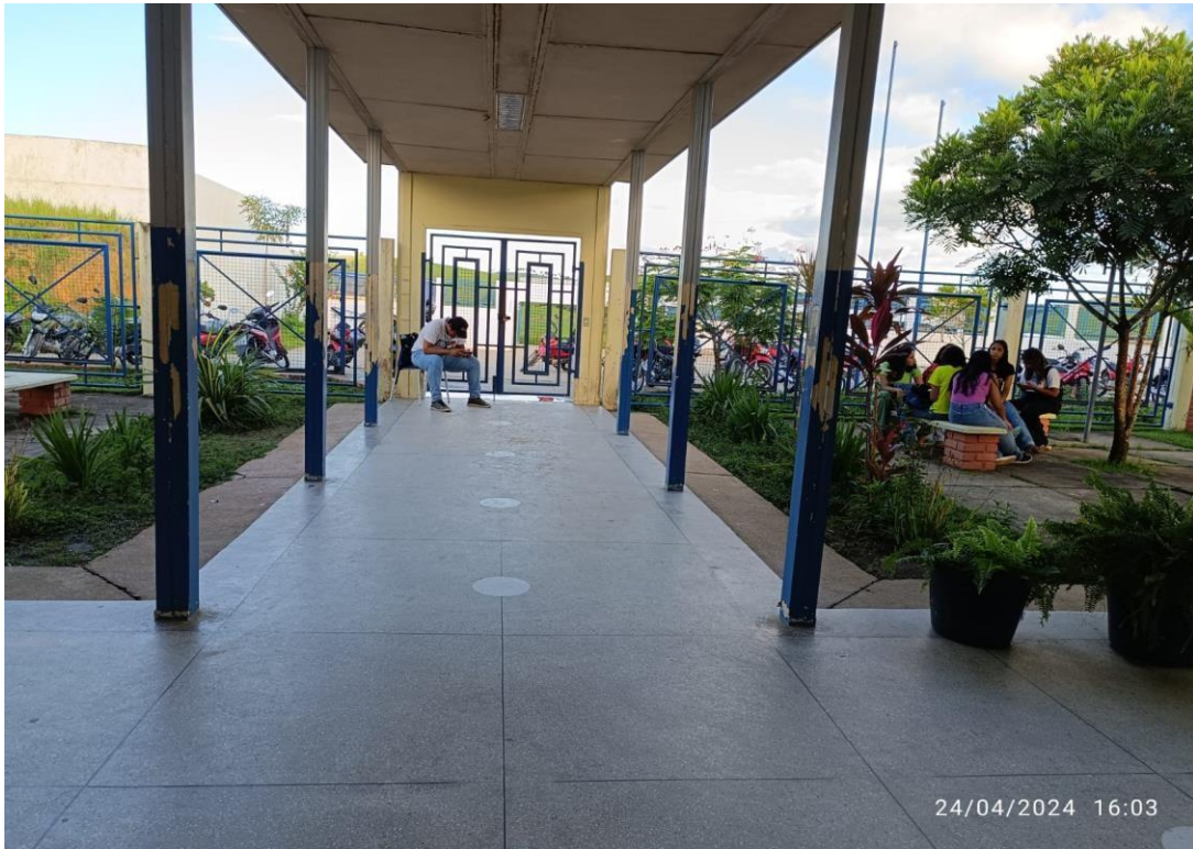
Figura 3: corredores acessíveis.