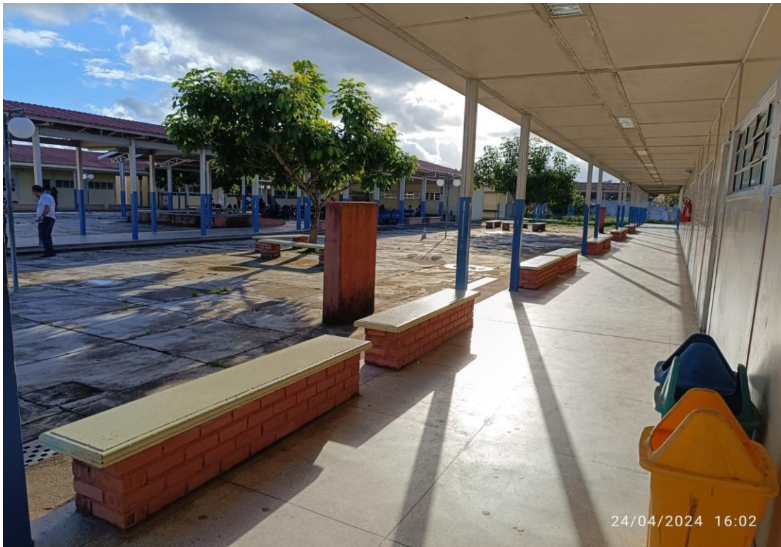
Figura 5: corredores de acesso às salas de aula.