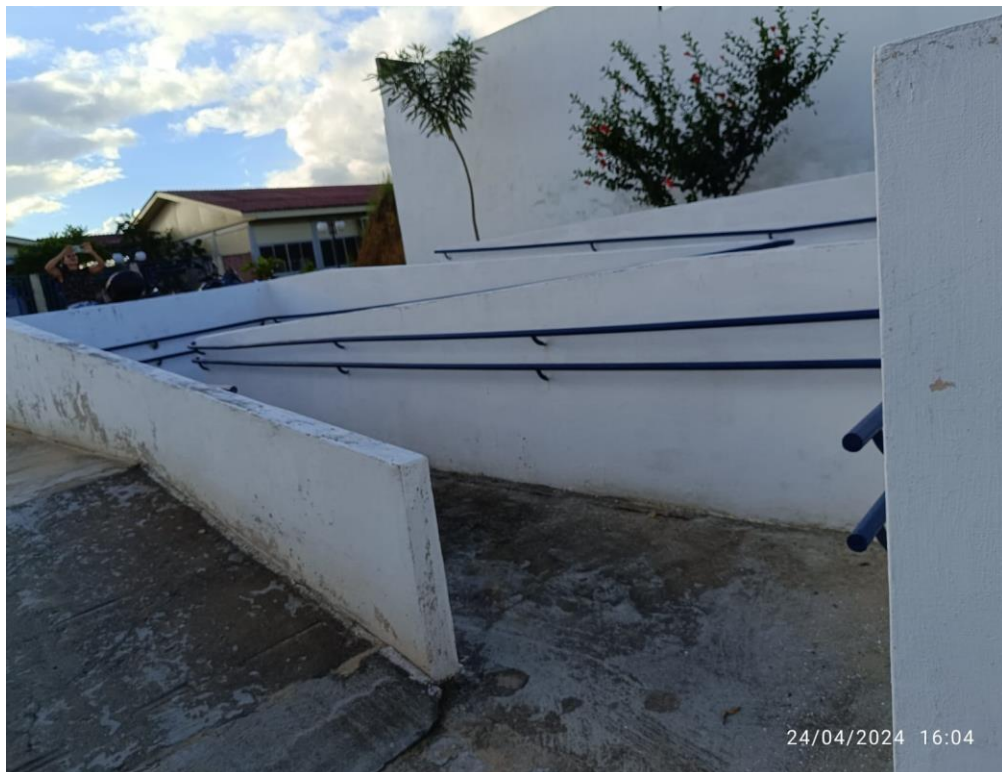
Figura 2: rampas de acesso