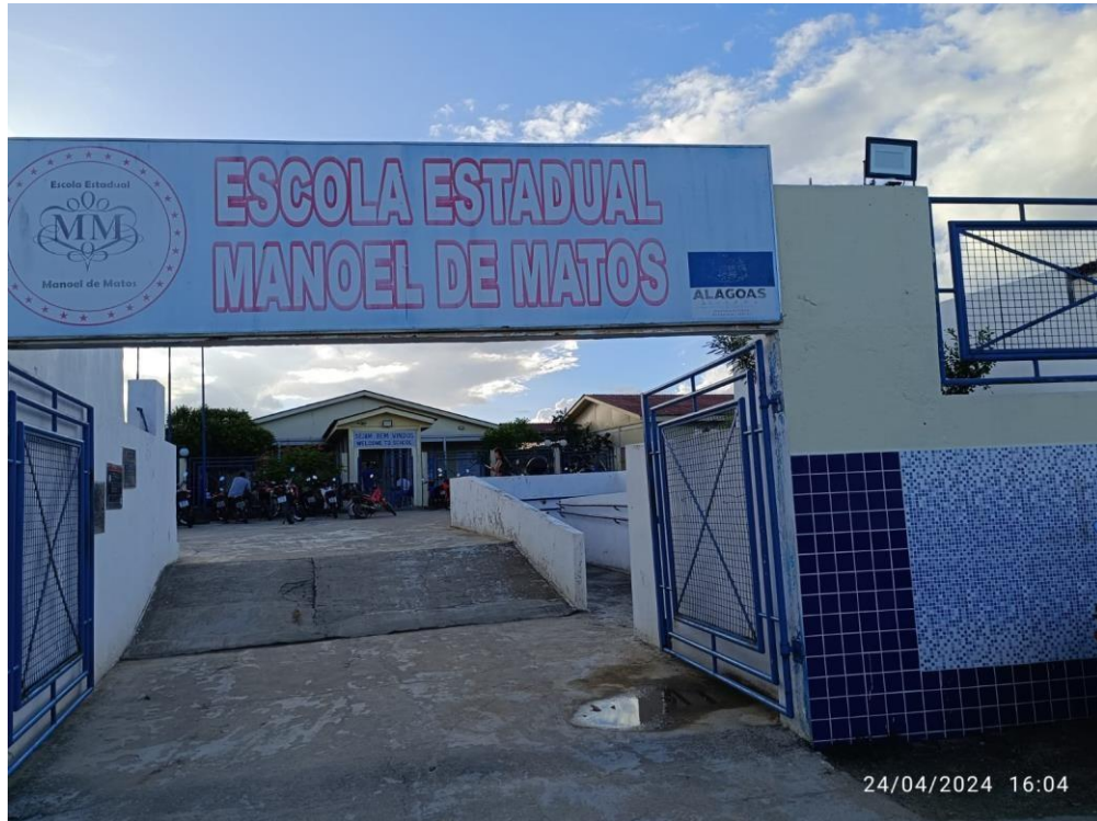
Figura 1: Entrada de acesso à escola, com acessibilidade para cadeirantes.