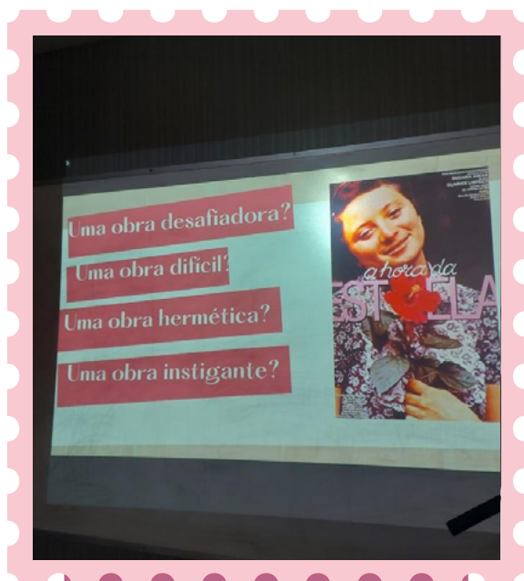
Imagem 6: Algumas indagações

Preliminarmente, projetamos slides com as seguintes indagações: A hora da estrela é uma obra hermética, desafiadora, difícil, instigante? O intuito foi que as estudantes expressassem o que pensavam sobre a obra. Isso rendeu algumas ponderações, antes de iniciar a leitura do ponto alcançado no encontro anterior.