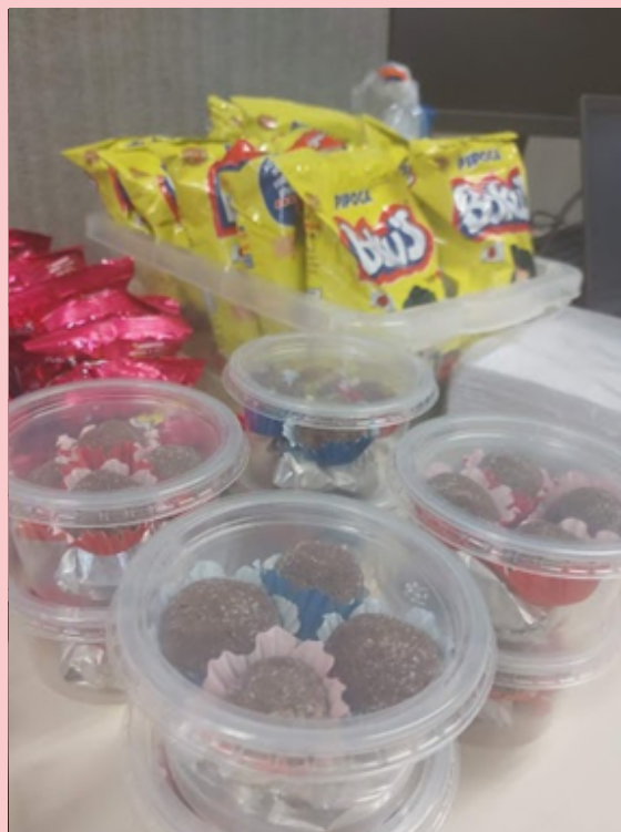
Imagem 9: Cine pipoca - Preparando o ambiente

Nesse dia, fizemos um cine pipoca, regado a guloseimas, e assistimos ao filme A hora da estrela, da diretora Suzana Amaral, que foi projetado no quadro, por meio do equipamento multimídia. O objetivo principal foi que as estudantes pudessem analisar e destacar as diferenças entre a obra lida e o filme.