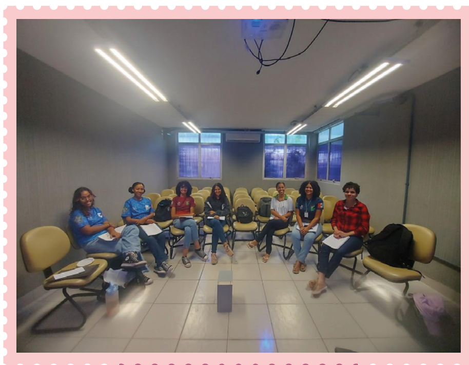
Imagem 7: Nosso universo participante

A promoção da mulher por meio de uma educação crítico-emancipatória