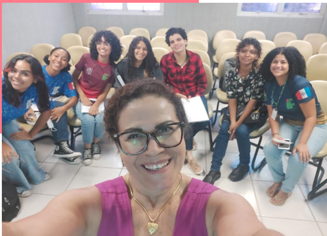
Imagem 13: Encerrando com foto

Se inicialmente as estudantes apresentaram ressalvas para participarem dos Círculos de Leitura, principalmente devido ao fator timidez e/ou receio de não conseguirem interagir, ao final perceberam a importância da leitura reflexiva e consciente, que pode ser aprofundada e interpretada, conforme o entendimento de cada leitor, sem contudo, extrapolar seus limites.