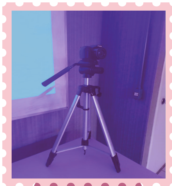
Imagem 2: Registrando os encontros

Nas seções seguintes, descrevemos a sequência dos Círculos de Leitura promovidos, que acompanha os temas desenvolvidos durante os encontros, e as falas consideradas mais relevantes das estudantes pelos pesquisadores.