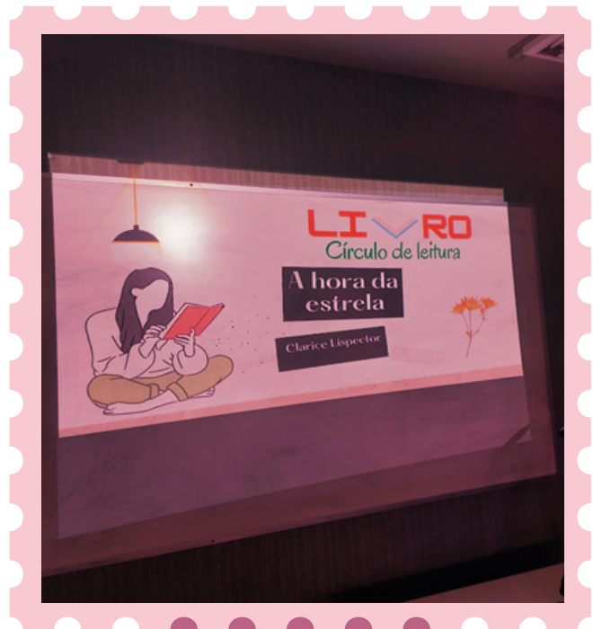
Imagem 1: conhecendo a obra

É uma história triste, que nos faz refletir sobre a migração nordestina e suas implicações, sobre a pobreza que assola não somente o/a nordestino/a, sobre as pessoas que vivem à margem da sociedade, por vezes invisibilizadas até aos olhos de quem as vê constantemente, sobre o interdito de identidade, entre outros aspectos que, conforme se lê, vai se encontrando.