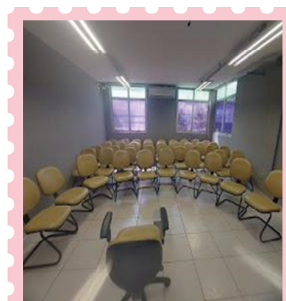
Imagem 5: E assim se fez o círculo...

As falas a seguir, que fizeram parte da análise de dados do nosso estudo, mostram a importância de se convidar estudantes para aderirem a projetos que objetivem incentivar a leitura ou a sua retomada.