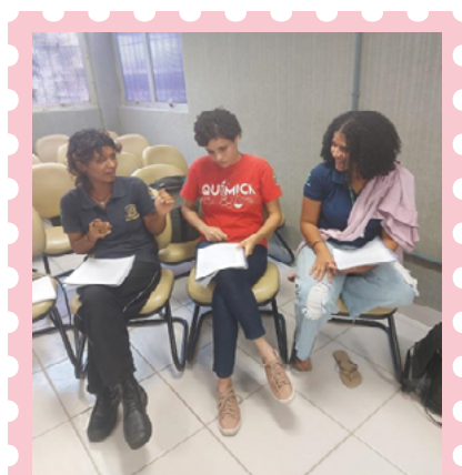
Imagem 3: Cópias entregues da obra

Nesse dia, distribuímos cópias do livro e lemos as páginas compreendidas entre 19 e 23.