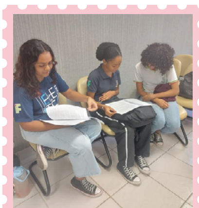
Imagem 4: analisando o material