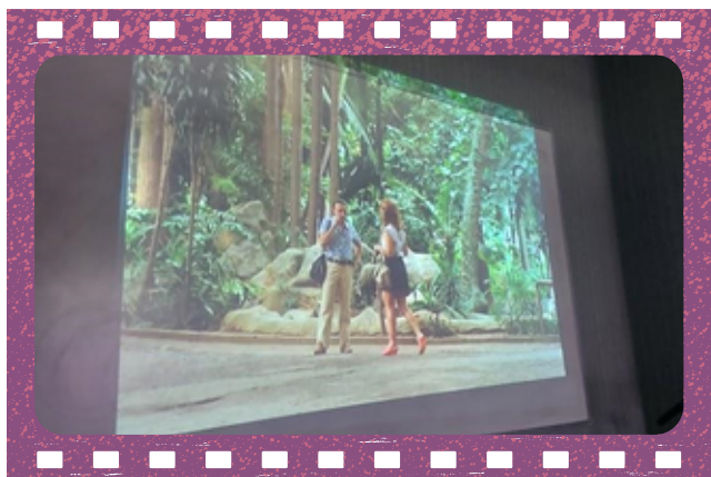
Imagem 10: Cena do filme A hora de estrela - 1