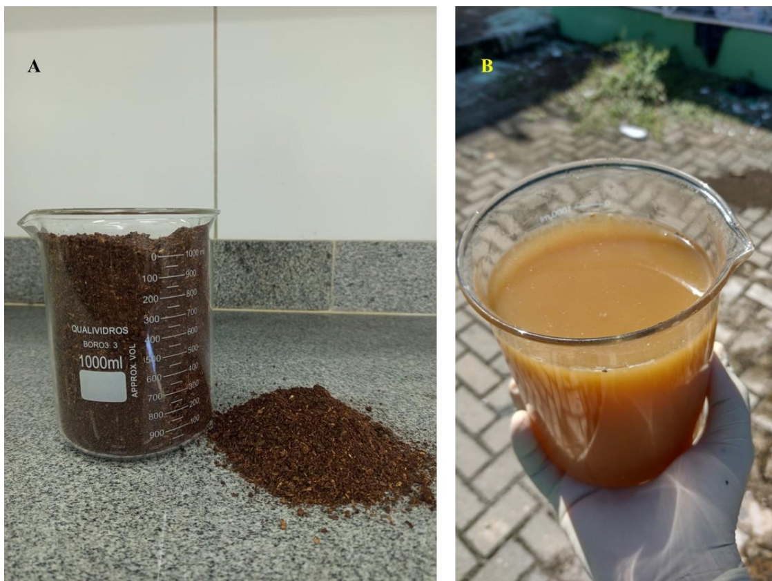
Figura 6. Biofertilizantes sólido (húmus, A) e líquido (chorume, B) obtidos da compostagem de resíduo da graviola.