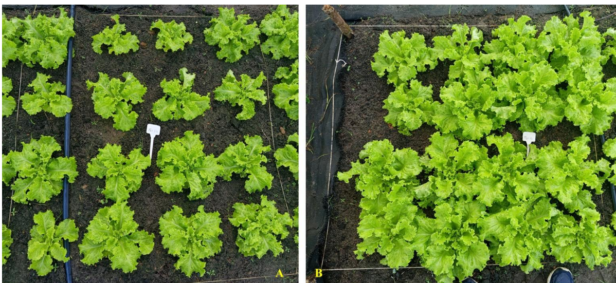
Figura 7. Avaliação preliminar de concentrações de chorume sobre alface (30 dias após o plantio): A) sem chorume; B) 40% de chorume diluído em água.

Veneranda (Figura 7), conduzidas em condições de campo indicaram efeito positivo do chorume sobre a altura da planta, número de folhas, área foliar, teores de clorofila A, B e total, massas secas da parte aérea, das raízes e sobre a produtividade (dados não publicados), indicando que este bioinsumo tem potencial para uso na horticultura.