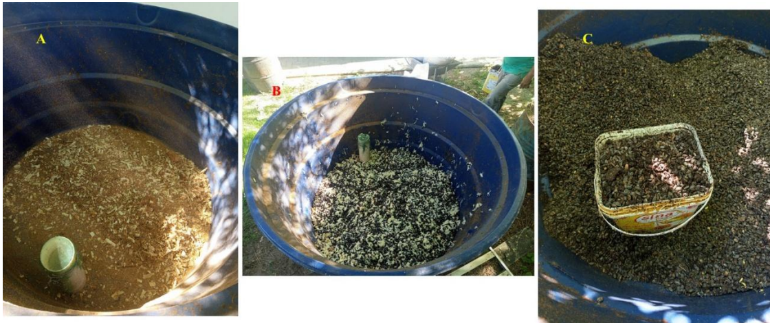
Figura 2. Camadas alternadas de serragem (A) e resíduo da graviola (B), e material compostado para inoculação (C).

de 1:1 (v:v) (Figura 2A, Figura 2B) ( usar máscara e luvas ). Recomenda-se adicionar material humificado (material já compostado ou camada superficial de mata nativa) como forma de inocular fungos e bactérias decompositores (Figura 2C), para acelerar o processo.