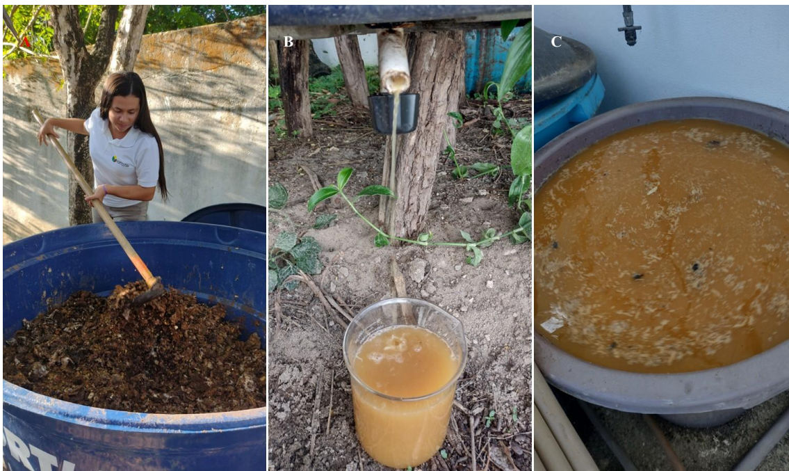
Figura 4. Prática de revolvimento da composteira (A), coleta do chorume (B) e armazenamento (C).

Após, aproximadamente, 60 dias após o fechamento da composteira, os resíduos já estarão compostados. Porém, será observado que as sementes estarão intactas (Figura 5A). Por esta razão, torna-se necessário que o composto seja seco ao sol e triturado em máquina forrageira ou moinho martelo (Figura 5B), com peneira de 5,0 mm ( usar máscaras e luvas ), para expor o conteúdo interno das sementes, não acessados pelos microrganismos. Em seguida, todo material é levado a composteira, para um novo período de compostagem, período que leva, aproximadamente, 30 dias. É possível que sementes de menor tamanho, como a da goiaba, não necessite dessa etapa.