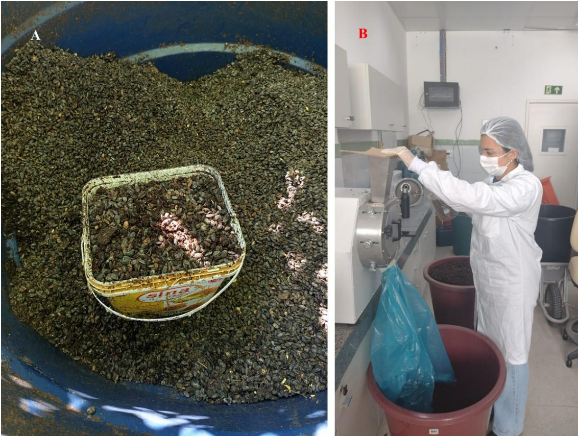
Figura 5. Composto após 60 dias, com a presença de sementes intactas (A) e trituração do composto seco (B).