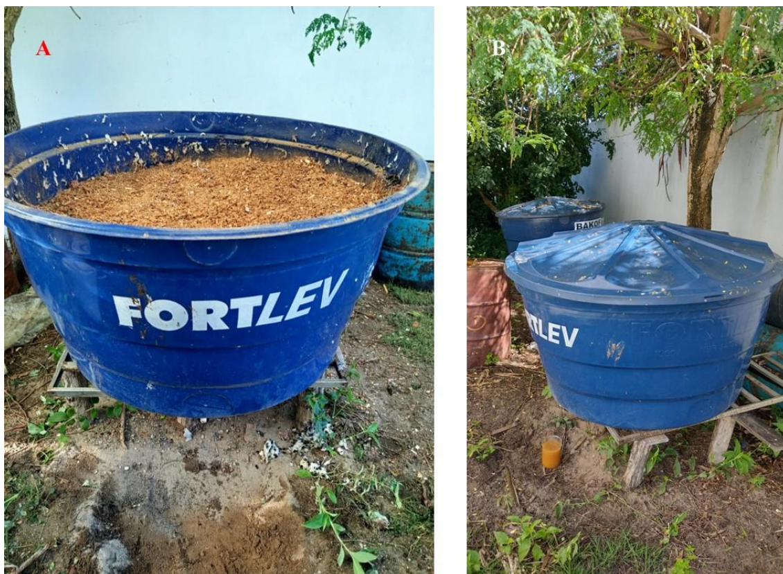
Figura 3. Cobertura do composto com serragem (A) e cobertura da caixa com tampa (B).