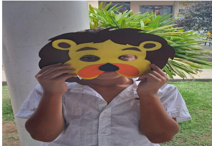
Figura 5 – O leão

Vemos, na figura 4, a imagem de um integrante da turma de terceiro ano do primeiro ciclo, a qual representação dada pelos alunos aquilo que lhe chamara mais atenção na obra A mulher que matou os peixes , de Clarice Lispector. Acontecendo, portanto, um momento de vivência artística e estética, em processo de interartes.