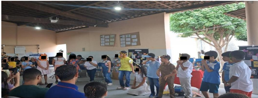
Figura 7 – A arte de fazer Literatura