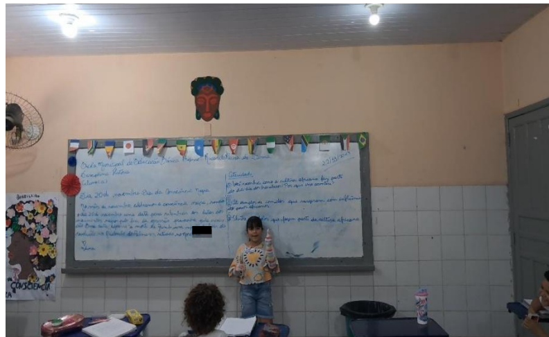
Figura 6 - Performance literária

Estes momentos, nos quais os discentes tomam os textos para si, interagem com eles e se expressam em forma de arte não se tratavam de leituras da obra, mas sim de performances literárias nas quais o leitor fazia parte da história, como um cenário, como personagem coadjuvante, como intertexto. Esse processo ocorria espontaneamente, pela naturalização da Literatura Ilustrada nesse nível de ensino.