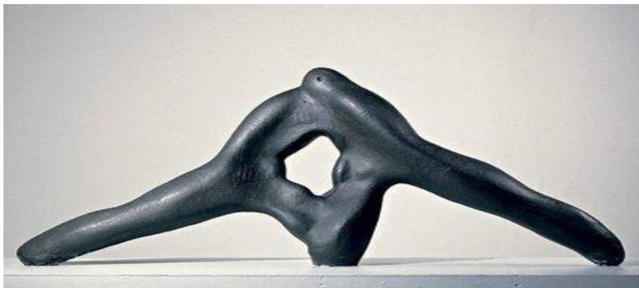
Figura 4 – Luta de Índios Kalápagos, Victor Brecheret