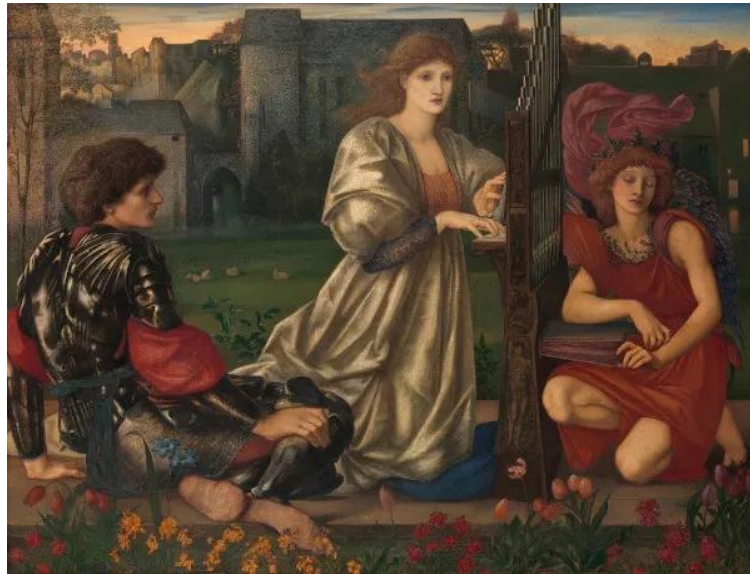
Figura 2 - Canção de Amor, de Edward Burne-Jones