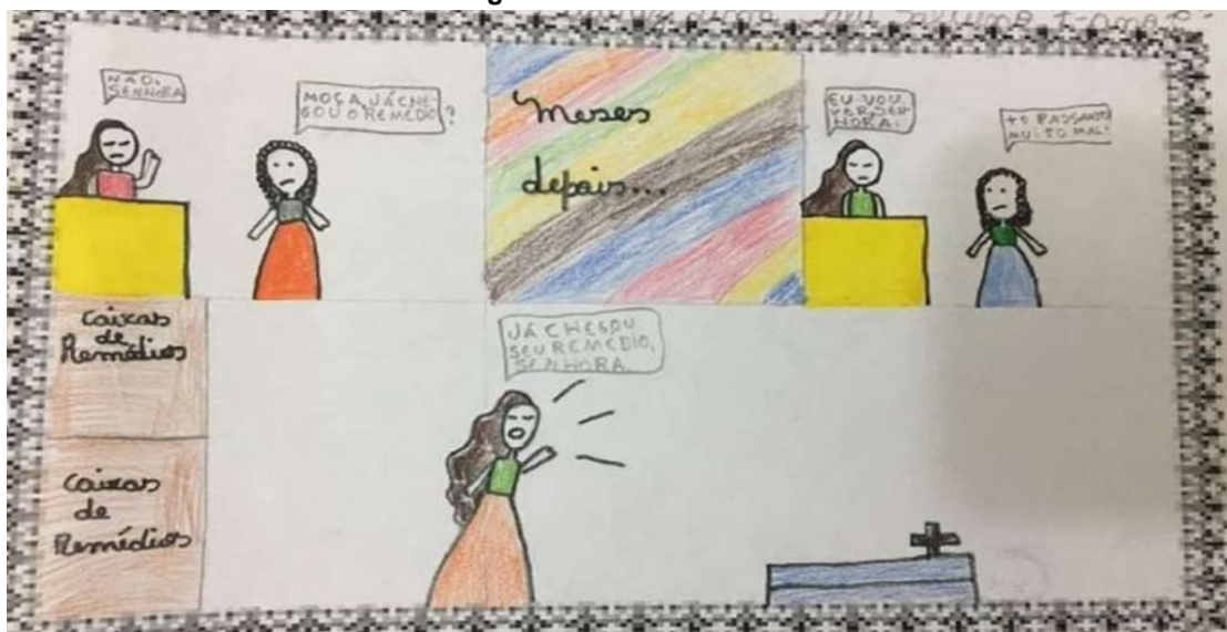
Figura 2 - Texto 2 - aluno B