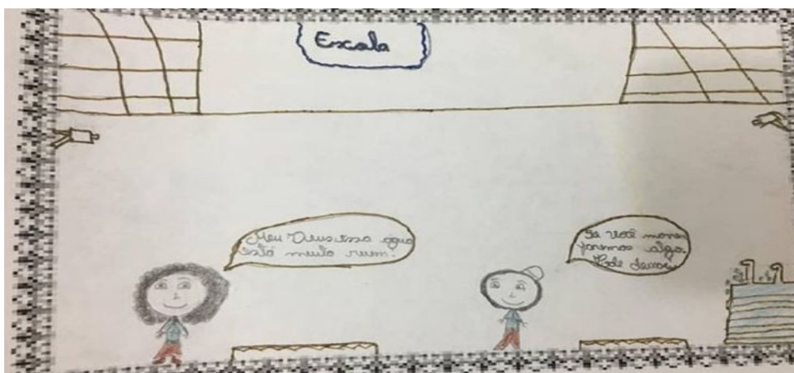
Figura 5 - Texto 5 - aluno E

Os textos acima caracterizam-se como pertencentes ao gênero charge, pois apresentam uma crítica de cunho social, fazendo uso das múltiplas linguagens e estabelece uma relação de sentido entre as modalidades da língua.