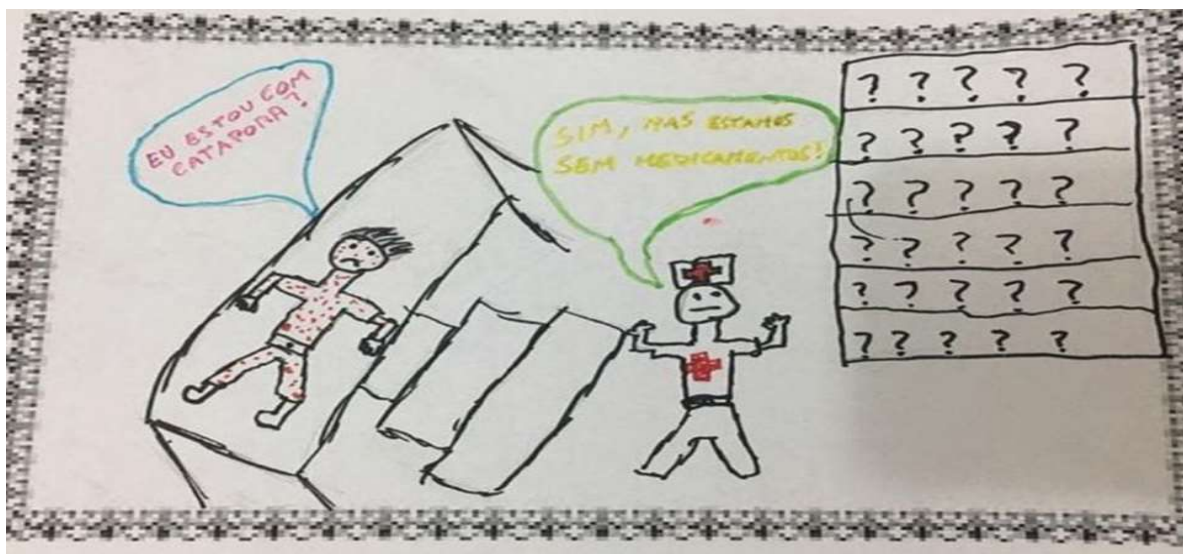
Figura 1 - Texto 1 - aluno A