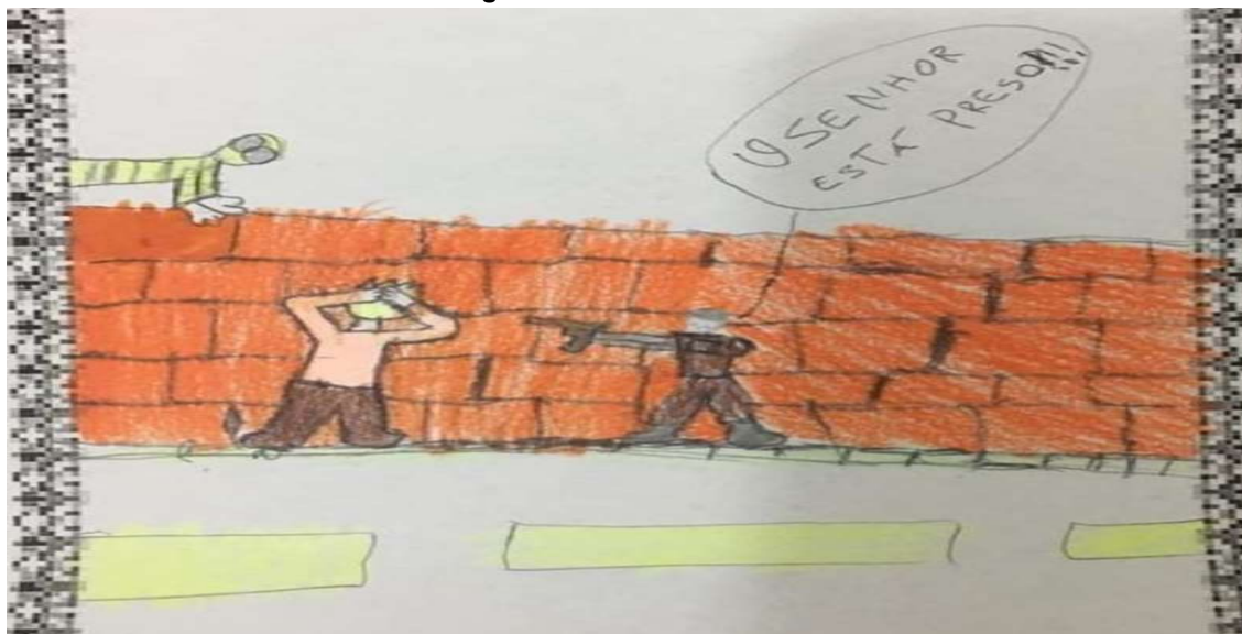
Figura 4 - Texto 4 - aluno D

O fato de o autor colocar a personagem olhando a cena pela janela, nos diz que aquela situação ocorre muito perto de onde ele está, tornando a ocasião ainda mais perigosa e evidencia a falta de policiamento e consequentemente a falta de segurança no local em que habitam.