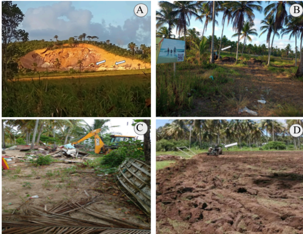
Figura 8. Retroescavadeiras à serviço da degradação ambiental e conflitos sociais em Porto de Pedras - AL. Setas indicando retroescavadeiras e tratores.

Nesses últimos dois casos a mobilização da população reverteu a situação, os pescadores atingidos pela derrubada de suas palhoças entraram com ação no Ministério Público, onde aguardam decisão (Cruz et al. , 2023). E, atualmente, o campo foi reformado, permanecendo em sua área original, contudo cercado de casas de veraneio e pequenas pousadas do estilo charme.