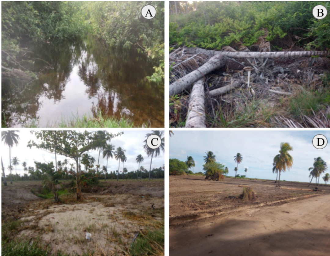
Figura 3. Empueiras (brejos de restingas) na praia de Lages, Porto de Pedras - AL. A) Mais preservada. B) Degradada após atividade consentida pelo IMA. C) Degradada por empreendimento próximo de sua área de ocorrência. D) Vegetação herbácea circundante a empueira removida para a realização do torneio Pure Beach em fevereiro de 2021.