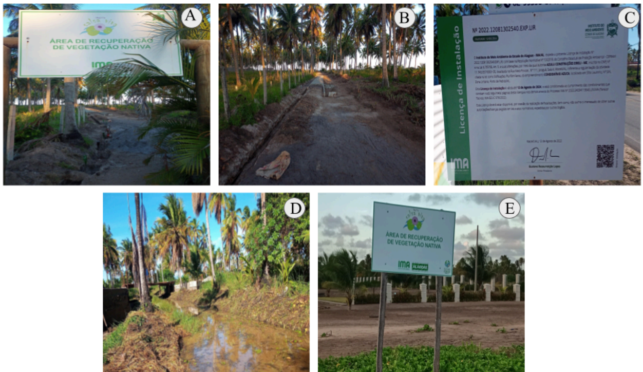
Figura 5. Áreas de conflitos socioambientais e degradação ambiental legitimados pelo Instituto do Meio Ambiente - IMA, nos povoados de Lages e Curtume, Porto de Pedras-AL.

Contudo, é fato que a população não detém nesses órgãos segurança para tratar desses problemas, seja pelo desconhecimento de seu papel enquanto sujeitos locais na preservação ou pela criminalização e retirada do protagonismo dessa população nas tomadas de decisões a respeito dos problemas que vêm ocorrendo localmente. Onde, pelos exposto por Cruz e colaboradores (2022, 2023), presumimos que o IMA assumiu um lado oposto da preservação ambiental e da população local, alguns exemplos também foram averiguados em nosso trabalho de campo (Fig. 5).