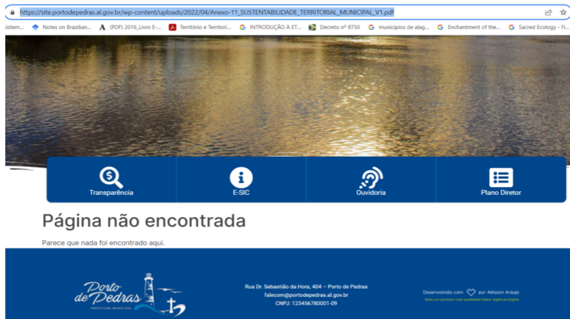
Figura 7. Site oficial da Prefeitura de Porto de Pedras o qual está ausente os documentos que correspondem ao plano gestor municipal.

problemas causados pelos que detêm o poder (Souza, 2006), conseguem minimizar a situação, ao contrário, agravam-se ainda mais. Como no caso da não divulgação do plano gestor municipal, pois seu desconhecimento pela falta de divulgação dá brecha para que as políticas públicas ambientais não sejam postas em prática.