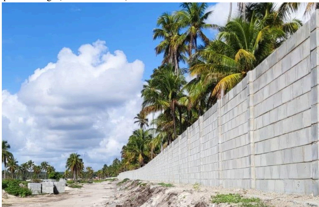
Figura 2. Muro de Condomínio em construção obstruindo o acesso dos moradores locais à praia de Lages, Porto de Pedras, AL.

Consiste no (re)ordenamento ou na (re)adequação espacial em função do interesse turístico. É uma interação entre fixos (território, paisagens etc.) e fluxos (capital, pessoas, padrões e valores culturais) que influencia as diferentes esferas da organização socioespacial (VASCONCELOS, 2005).