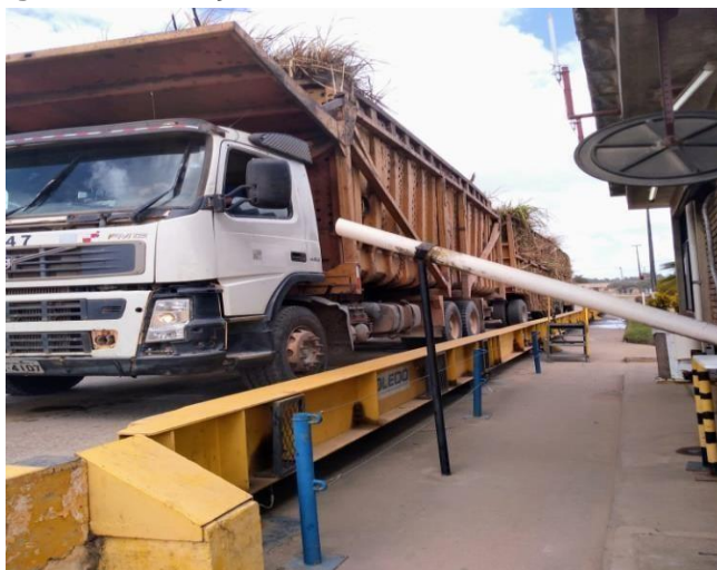
Figura 2: Balança Rodoviária da Unidade MARITUBA.