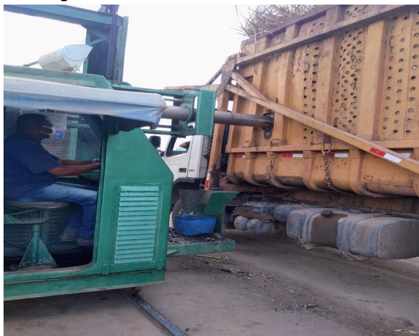
Figura 3: Sonda Horizontal da Usina MARITUBA.