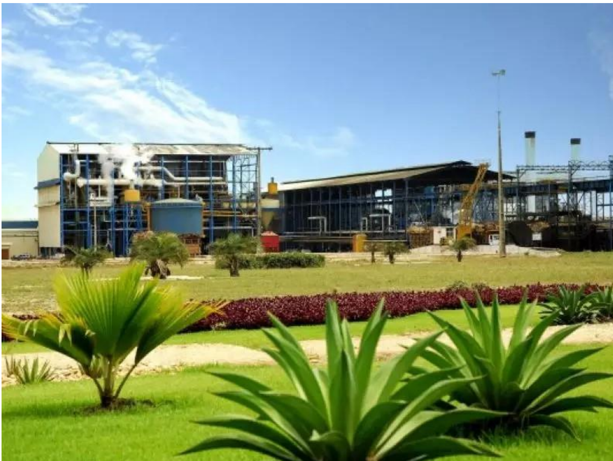
Figura 1: Fachada da Unidade MARITUBA.