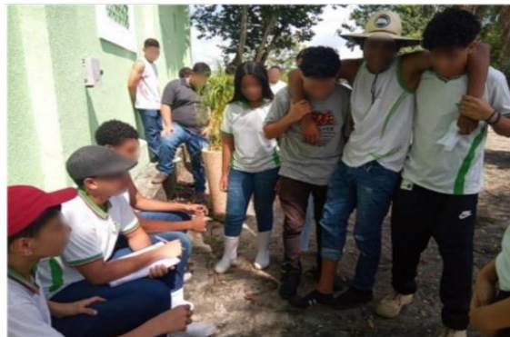
Figura 3 - Apresentação do Teatro-Fórum 2.

Momento do Fórum 2 - Neste momento, o Curinga (mediadora/professora/pesquisadora) pediu uma pausa na encenação. Estabelece o fórum de discussão, para refletir sobre os problemas postos em cena. A plateia foi convidada a discutir, a se posicionar e atuar na cena para mudar ou amenizar as situações de opressão que os técnicos em Agropecuária estavam vivenciando. Uma estudante, que estava na plateia, entrou em cena, com a personagem de uma empresária local com um perfil ambientalista, questionando a irresponsabilidade dos diretores pela falta de EPI e pelos crimes ambientais e de saúde pública que aquelas práticas agrícolas criminosas vinham causando na população e nos trabalhadores. Após a investigação, a empresa foi obrigada a seguir as normas de conduta que regulamentam a profissão de Técnico em Agropecuária, sendo dois diretores presos por causarem danos à saúde da população.