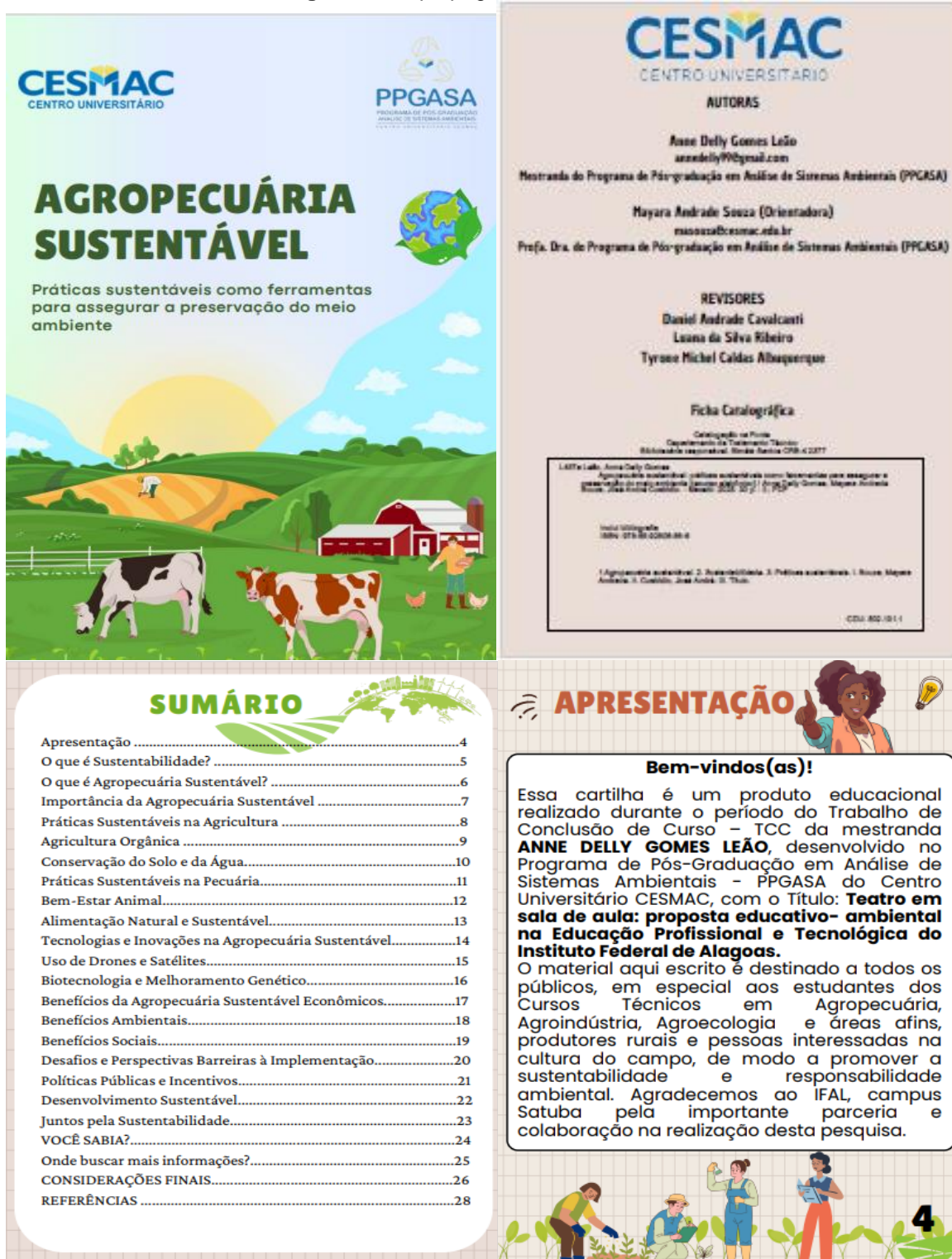
Figura 9 - Capa páginas da cartilha ilustrada.

Esse material contou com a colaboração do professor da disciplina Agricultura do IFAL/Campus Satuba. Segue abaixo capa e algumas páginas do conteúdo da cartilha.