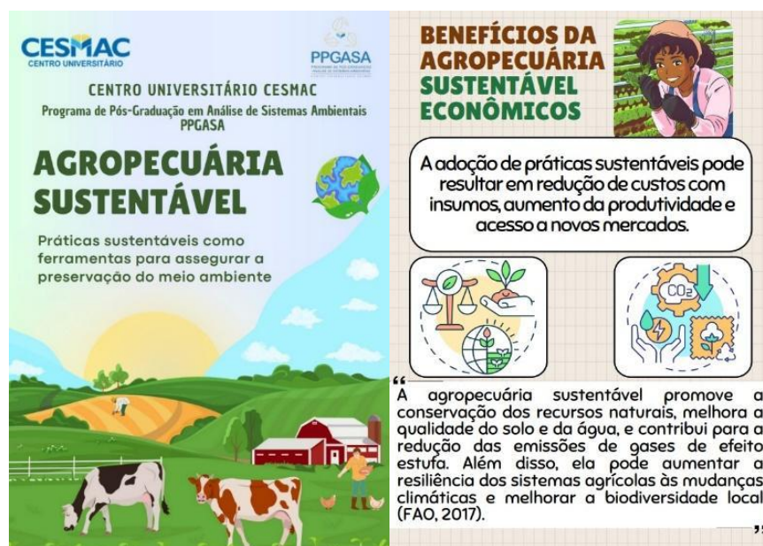
Figura 4 - Capa da cartilha e conteúdo abordado.

https://www2.ifal.edu.br/campus/satuba/noticias/professora-do-campus-satuba-publica-cartilha-sobre-agropecuaria-sustentavel , destinados a toda comunidade acadêmica do contexto investigado. Para visualização do vídeo segue o link: https://youtu.be/ODi6Qw72Dcw .