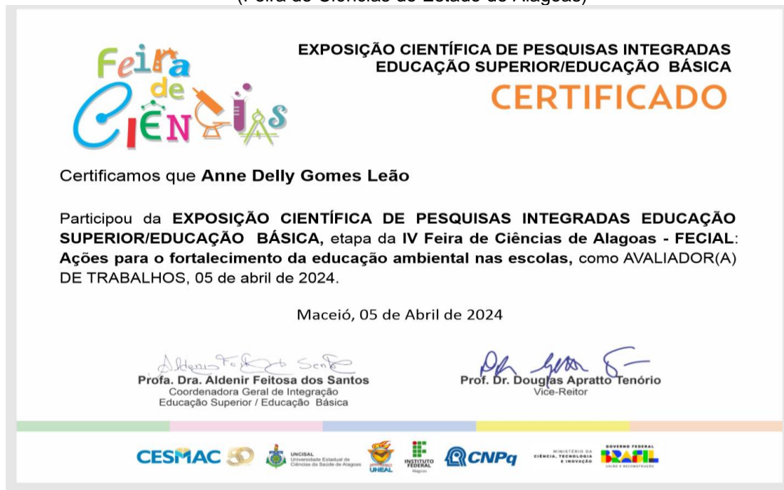
Figura 8 - Certificado de Avaliador na IV FECIAL. (Feira de Ciências do Estado de Alagoas)