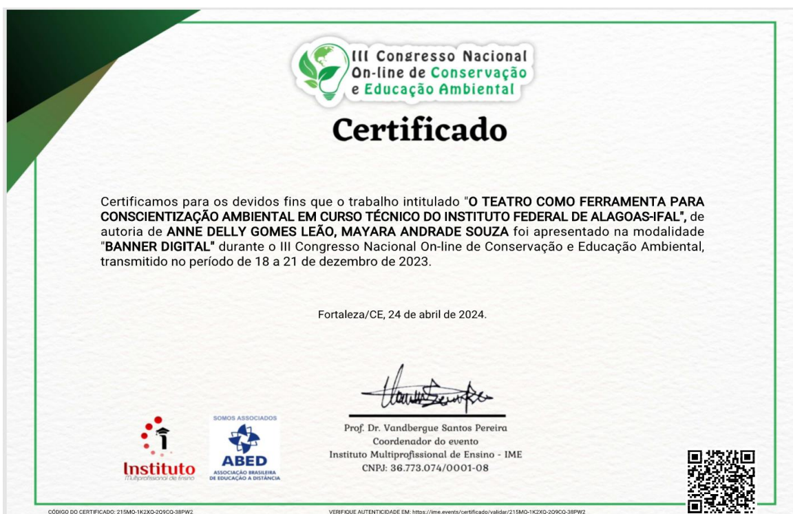
Figura 11 - Certificado de trabalho no III CONEAMB (Congresso Nacional Online de Conservação e Educação Ambiental)

O evento IV ENCONTRO DE PÓS-GRADUAÇÃO STRICTO SENSU de Maceió, realizado entre os dias 07 a 09/12/2022, com a temática Pesquisa Acadêmica em pós-graduação, organizado pela UNCISAL, oportunizou a apresentação do resumo de título O Teatro em sala de aula: proposta educativo-ambiental na Educação Profissional e Tecnológica do Instituto Federal de Alagoas, publicado nos Anais (ISBN 978-65-5872-502-2).