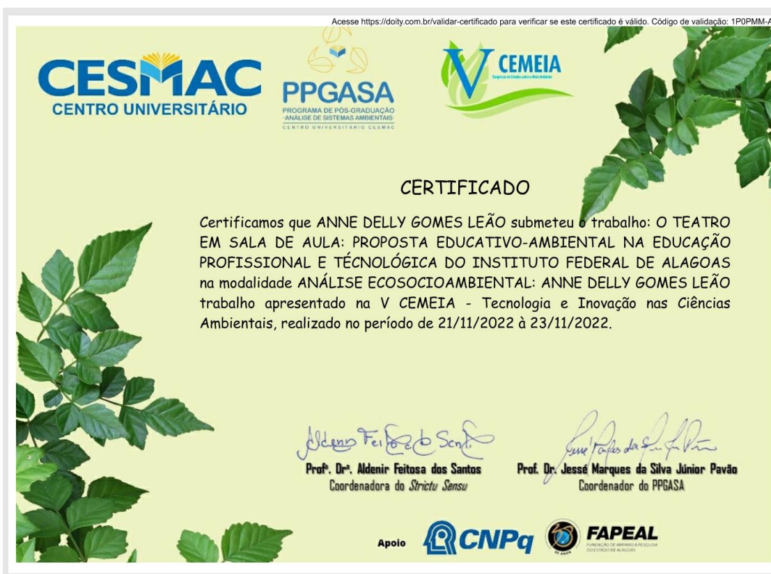
Figura 13 - Certificado de trabalho no V CEMEIA (Congresso de Estudos Sobre Meio Ambiente)