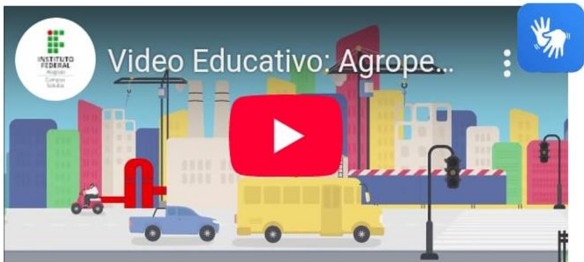
Figura 10 - Imagem inicial do vídeo educativo.

Youtube pelo link: https://youtu.be/ODi6Qw72Dcw .