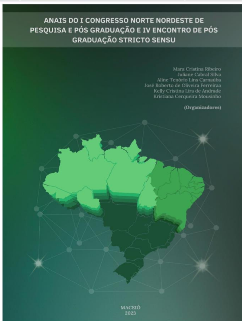
Figura 7 - Capa Anais IV Encontro de Pós-Graduação Stricto Sensu.