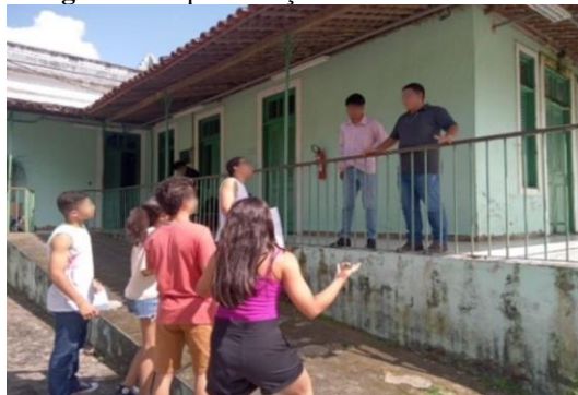
Figura 2 - Apresentação do Teatro-Fórum 1.

Neste momento, a encenação foi parada pelo Curinga, que é o mediador entre os atores e a plateia (neste caso, a professora/pesquisadora). O problema foi posto na cena, o fórum de discussão foi estabelecido e alguém ou um grupo de pessoas da plateia pode resolver. Alguns estudantes opinaram como esse problema deveria ser resolvido e foram convidados a entrar na cena e atuarem mudando o rumo da história. Eles entraram como investigadores, esclareceram os crimes e prenderam os criminosos. Depois, responsabilizaram a fábrica pelos crimes ambientais.