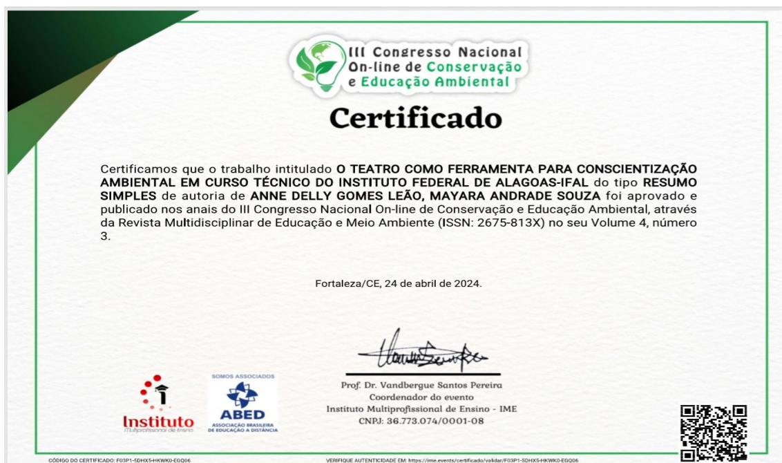
Figura 5 - Certificado nos Anais do III CONEAMB (Congresso Nacional Online de Conservação e Educação Ambiental).

Para divulgação da pesquisa, trabalhos científicos foram apresentados em eventos científicos. O evento III CONEAMB (Congresso Nacional Online de Conservação e Educação Ambiental) oportunizou a apresentação do resumo de título O teatro como ferramenta para conscientização ambiental em curso técnico do Instituto Federal De Alagoas (IFAL) realizado nos dias 24/04/2024 com a temática conservação e educação ambiental, e foi publicado no ANAIS Revista multidisciplinar de Educação e Meio Ambiente (ISSN: 2675-813X). Segue abaixo o certificado e a primeira página do resumo publicado no evento: