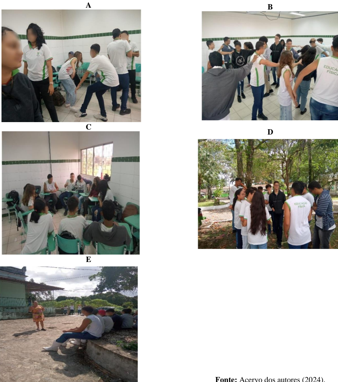
Figura 1 - Oficina de jogos teatrais: Aquecimento corporal (A); Expressão corporal (B); Discussão sobre o trabalho do técnico em agropecuária e possíveis problemas enfrentados (C); Oficina ao ar livre: discussão para montagem dos roteiros e ensaios das cenas de Teatro-Fórum (D); Apresentação do Teatro-Fórum, no local onde os estudantes fazem aulas prática de Agricultura (E).