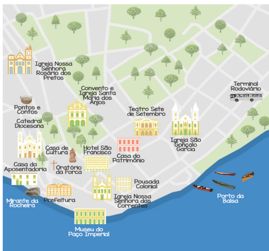
Imagem 1: Centro histórico de Penedo.

Por volta do século XVII foi construída uma capela dedicada a Santa Efigênia, ela foi erguida por escravos onde hoje se encontra a Igreja de Nossa Senhora do Rosário dos Pretos. A capela-mór foi iniciada em 1634, essa construção foi sendo adiada inúmeras vezes por poucos recursos disponíveis, devido a isso a construção da nave só teve início no ano de 1790, estendendo-se essas construções até 1836. Ernani Méro (1991) aponta que essa igreja seguiu o mesmo padrão de todas as outras igrejas da fase barroca no Brasil, apresentando formas simples em sua estrutura arquitetônica e nas pinturas que compõem o templo.