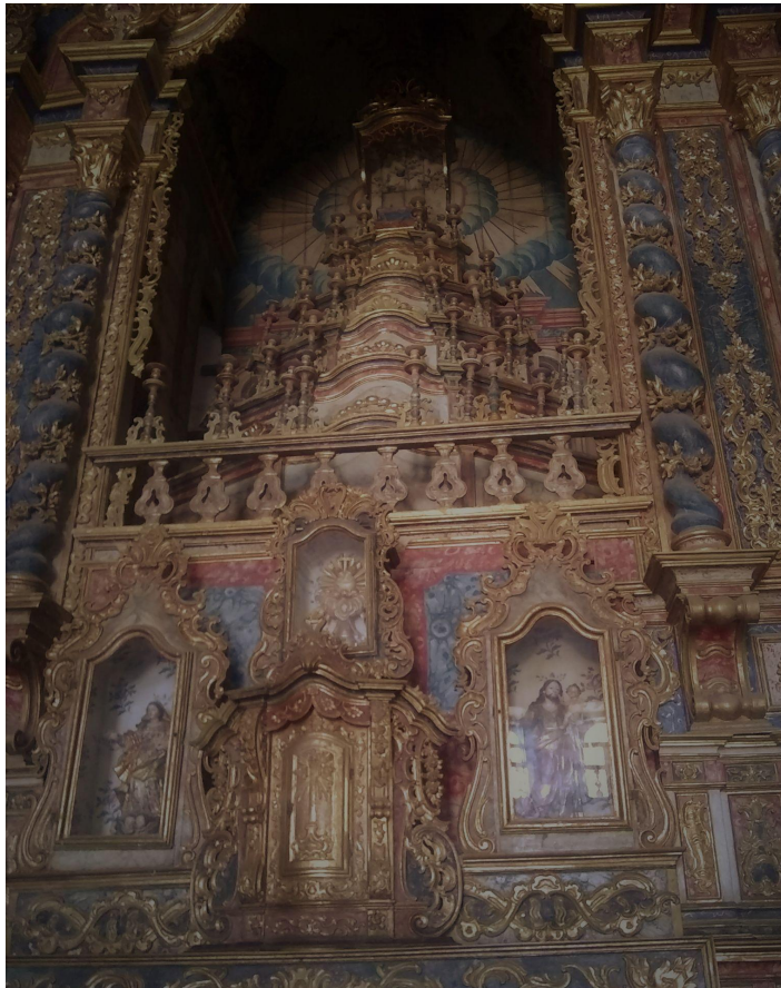
Imagem 6: altar da Igreja de Nossa Senhora da Corrente.

que os turistas e antiquários não conseguiram roubar. Deus é barroco. Deus é como os morcegos: voando à noite entre os espaços estrelados procura chupar o sangue dos homens que enegrecem o dia com os seus pecados. Na abóbada da igreja que o rio às vezes invade os morcegos escondem o céu alegórico eternamente sonogado aos pecadores. O céu negro dos homens! Sob o soalho avariado os ratos se inclinam à Presença eucarística. E Nossa Senhora da Corrente, padroeira dos ratos e morcegos, entre flores de papel e velas fedorentas compartilha da solidão divina. Ó Mãe dos homens, que sorri radiosa em seu abandono como a minha própria mãe, rogai por mim!