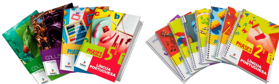
Figura 1 – Fotos dos materiais analisados: