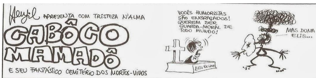
Figura 3: Charge do Henfil