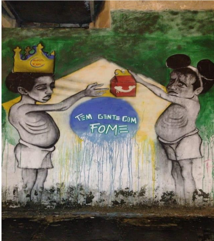
Imagem 1: Manifestações artísticas em Maceió/AL