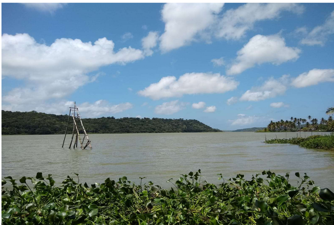
Figura 3 - Lagoa de Jequiá (área da Resex)