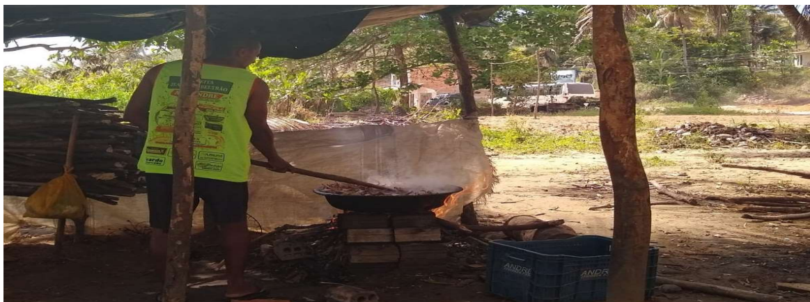
Figura 6 -Pescador utilizando lenha para cozimento do pescado.