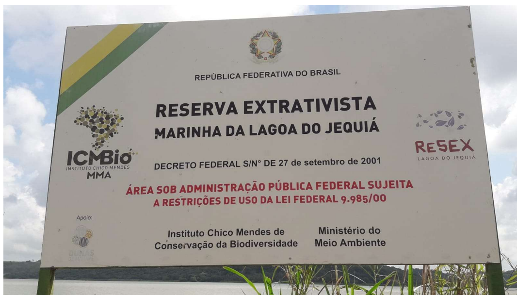
Figura 4 – Placa de identificação da Resex Marinha Lagoa do Jequiá