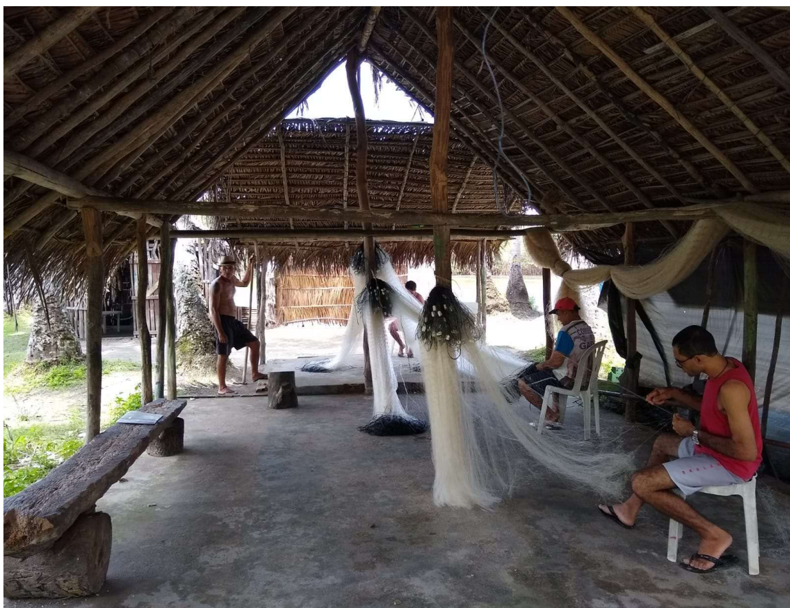
Figura 5 – Área de agrupamento construída pelos pescadores da região.