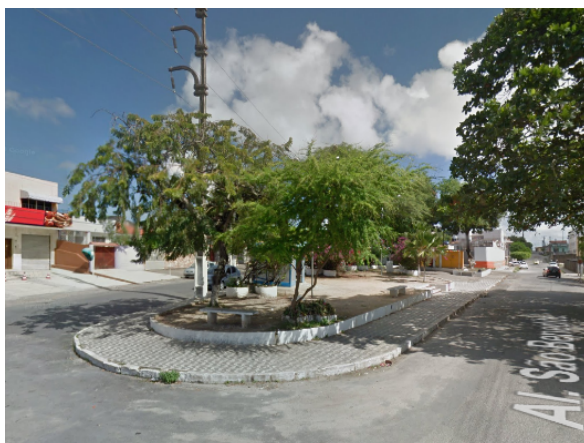
Figura 13 – Praça Menino Jesus de Praga, em 2012