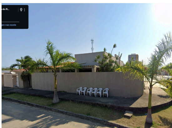
Figura 9 – Calçada onde eram realizados os encontros diários do Senadinho, em 2019