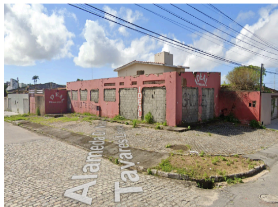
Figura 8 – Padaria Ideal em 2022, após desocupação