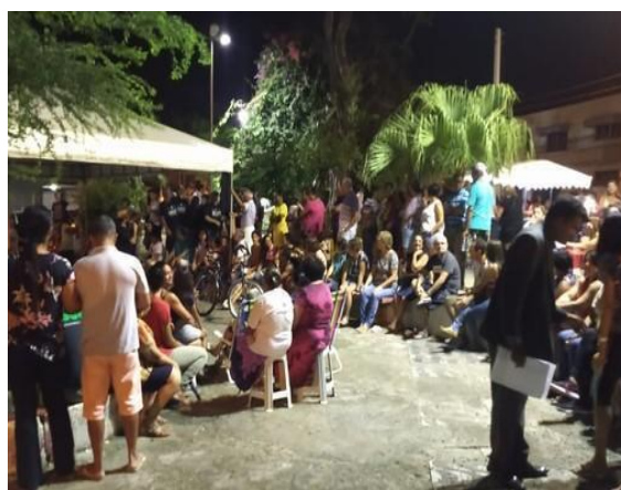
Figura 14 – Praça Menino Jesus de Praga em 2019, que passou a ser o principal local de reuniões das pessoas atingidas