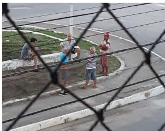
Figura 12 – Reunião de vizinhos na Praça Arnon de Melo, em 2019