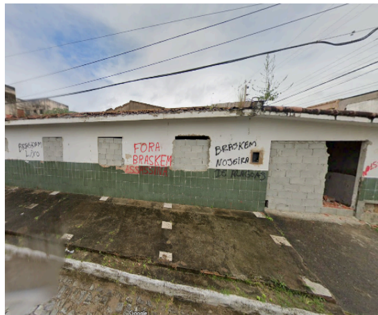
Figura 2 – Bar do Brandão em 2022, após desocupação