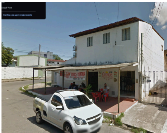
Figura 5 – Bar da Greyce em funcionamento, em 2012

Sobre o Bar da Greyce (Figuras 5 e 6), o mesmo entrevistado afirmou que o estabelecimento não atraía apenas os moradores do Pinheiro, como também de outros bairros. “Tinha até campeonato de dominó. Os próprios clientes reformaram o bar, para que pudesse fazer o campeonato de dominó, o que demonstra o sentimento de solidariedade existente no bairro” (Entrevistado 1).