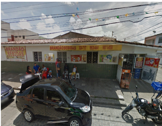
Figura 1 – Bar do Brandão em funcionamento, em 2017