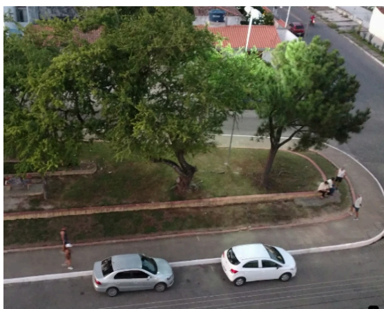
Figura 11 – Praça Arnon de Melo em 2016

A Praça Menino Jesus de Praga era mais emblemática, tudo levava a ela. Era um conjunto muito próximo um do outro. Você tem a praça, o Churrasquinho da Fátima, o Mercadinho Pilar, o Depósito do Brandão. Então, tudo isso aí, vivia em constante dinâmica, era um conjunto harmônico, não dá para separar um do outro (Entrevistado 1).