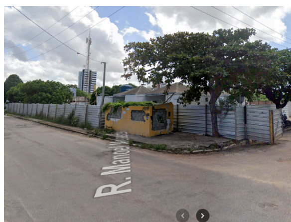
Figura 4 – Churrasquinho da Fátima em 2022, após desocupação