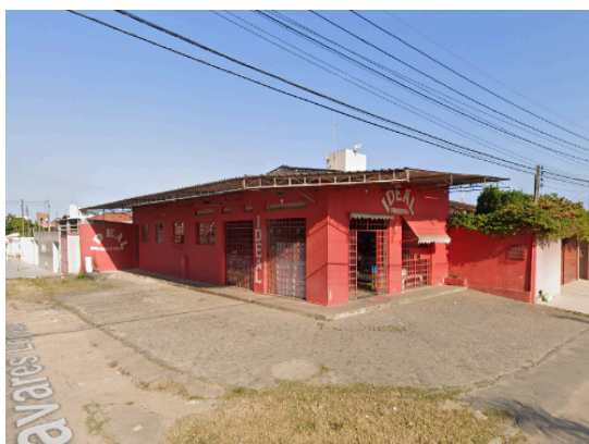
Figura 7 – Pararia Ideal em funcionamento, em 2019