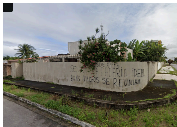
Figura 10 – Calçada do Senadinho em 2022, com a mensagem no muro: “Desde 1999. Senado da Padaria Ideal, bons amigos se reúniam”